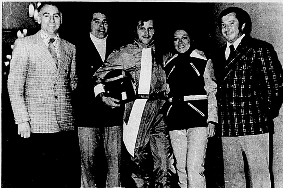
Une intéressante parade de mode se déroulait récemment sous les auspices du Club Auto-Neige Laurentide. Au programme, on pouvait admirer les récentes créations allant de pair avec le sport de la Motoluge (Moto-Neige). Il ne fait aucun doute que ce sport autorisé augmente de jour en jour son nombre d'adeptes. Les récentes réglementations concernant la moto-neige démontrent jusqu'à