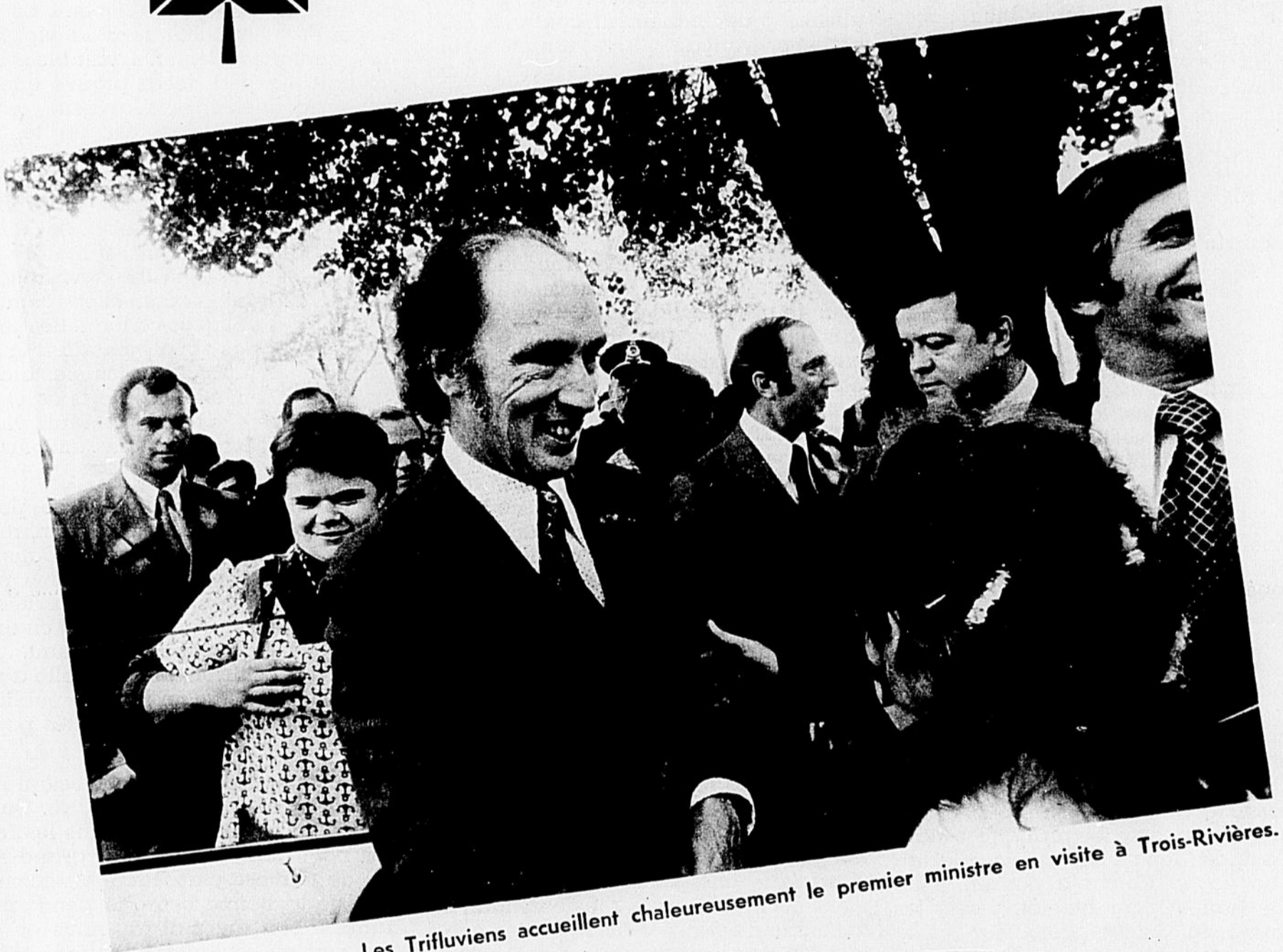
Les Trifluviens accueillent chaleureusement le premier ministre en visite à Trois-Rivières.