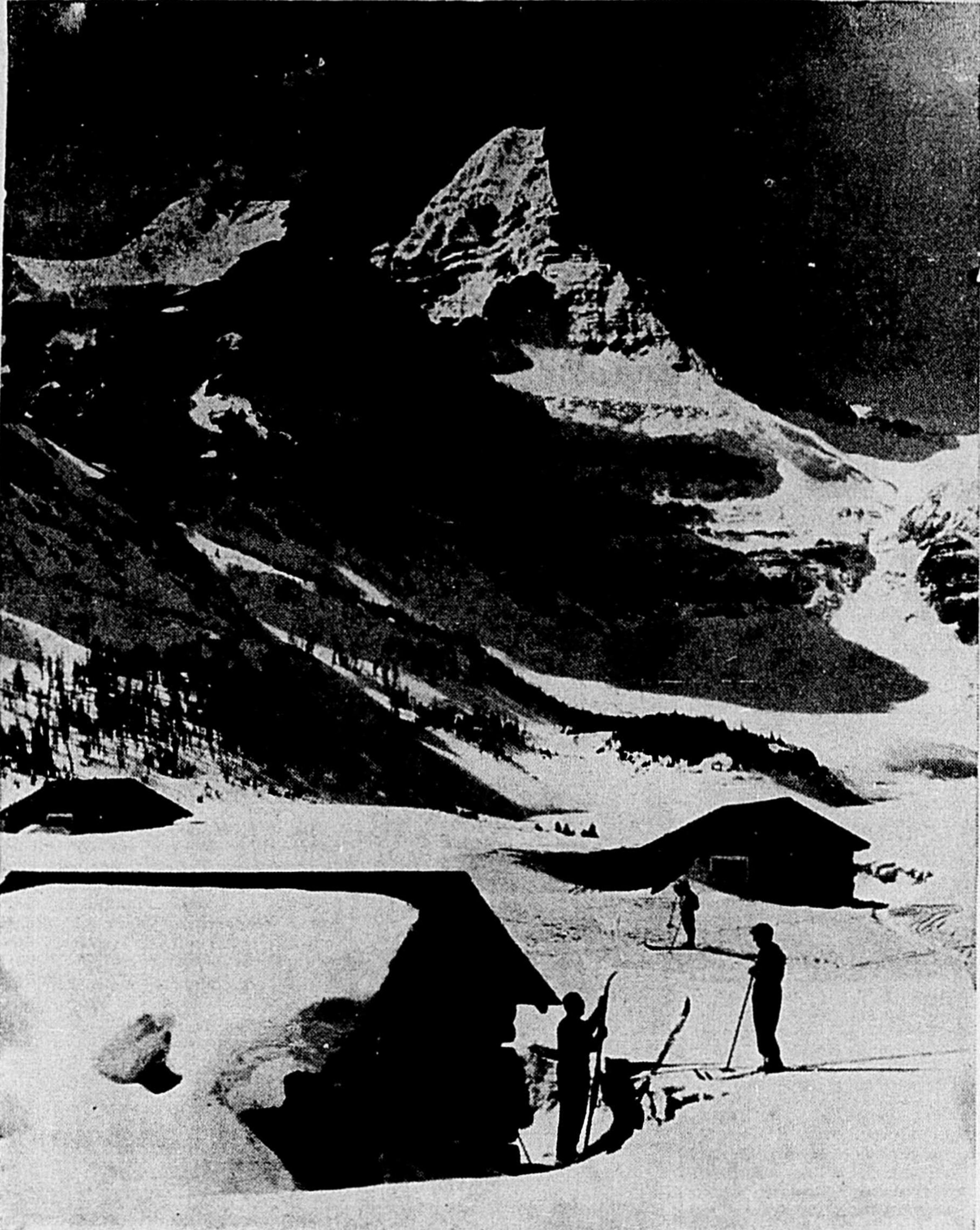
SUPERBE REGION POUR LE SKI —Depuis quelques années, l'attention des skieurs se porte de plus en plus vers les Rocheuses canadiennes, où l'on trouve, au milieu d'incomparables panoramas, des pentes uniques en Amérique. Les environs de Banff et du lac Louise, avec leurs monts gigantesques, se prêtent tout particulièrement à la pratique du ski de grande classe. Nous voyons ici un camp de skieurs au pied du fameux mont Assiniboine, dont la forme rappelle celle du Matterhorn, dans les Alpes.