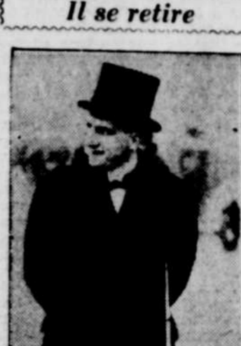
Il se retire

Ils ont occupé sans résistance la ville importante de Quoram après avoir fait subir une défaite écrasante aux troupes d'élite de l'empereur Haïlé Sélassié et leur avoir tué des milliers d'hommes. — Des avions italiens ont bombardé hier, les quartiers généraux du prince héritier Asfa Wosan.