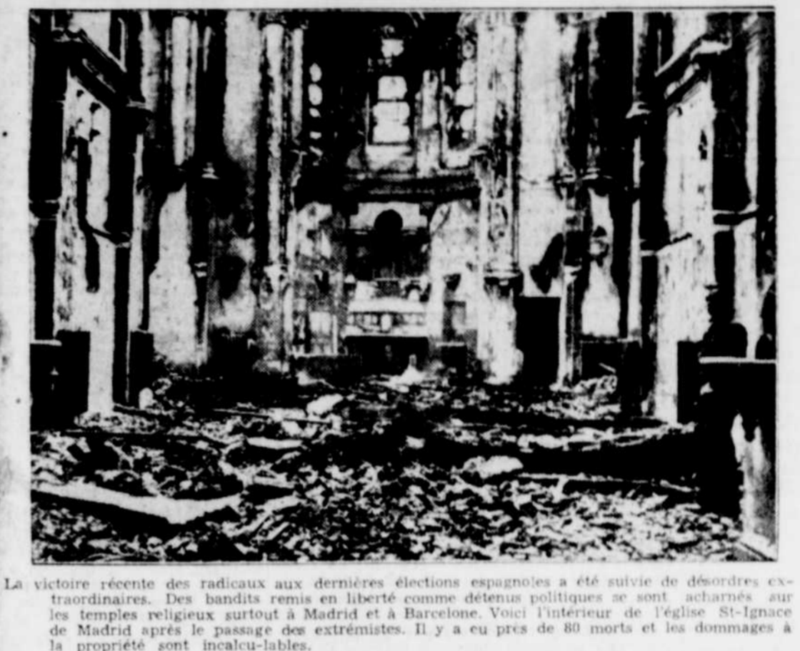
La victoire récente des radicaux aux dernières élections espagnoles a été suivie de désordres extraordinaires. Des bandits remis en liberté comme détenus politiques se sont acharnés sur les temples religieux surtout à Madrid et à Barcelone. Voici l'intérieur de l'église St-Ignace de Madrid après le passage des extrémistes. Il y a eu près de 80 morts et les dommages à la propriété sont incalculables.