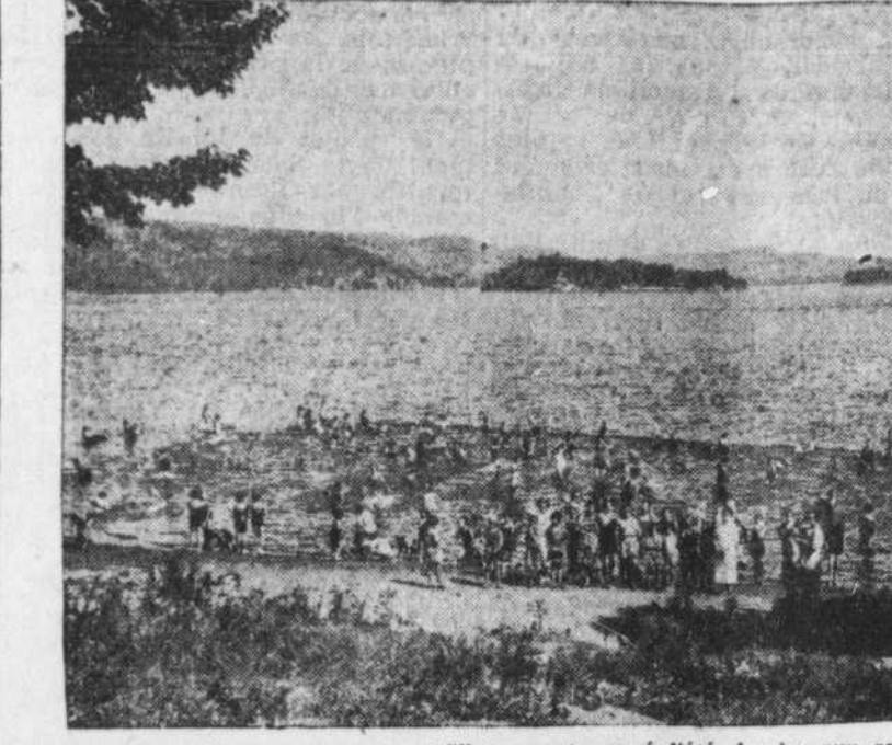
Six cent treize enfants, garçons et filles, ont passé l'été dernier aux camps de Santé Bruchési, près du lac L'Écluse. Ces camps ne relèvent que des enfants menacés de tuberculose...