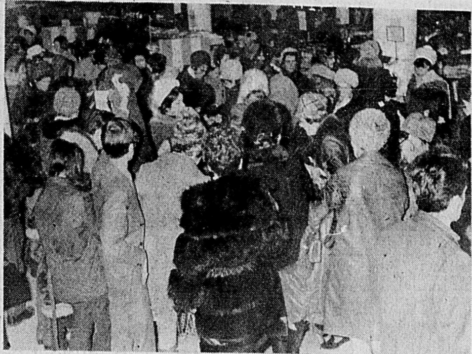
LA RUEE VERS LES AUBAINES — Après les fêtes, c'est aussi une tradition pour tous les magasins de "faire des ventes". Ces ventes sont si populaires qu'elles attirent des centaines et des centaines d'acheteurs ou de prétendus acheteurs. On se bouscule, on se rue, on s'entasse et on... dépense. ....

Cette décision a été annulée, hier, par quatre juges de la Cour d'appel du Québec, qui en sont venus à la conclusion que l'appel n'éliminait en aucune façon les effets de l'injonction interlocutoire. Sur le banc de cinq juges, un seul fut dissident.