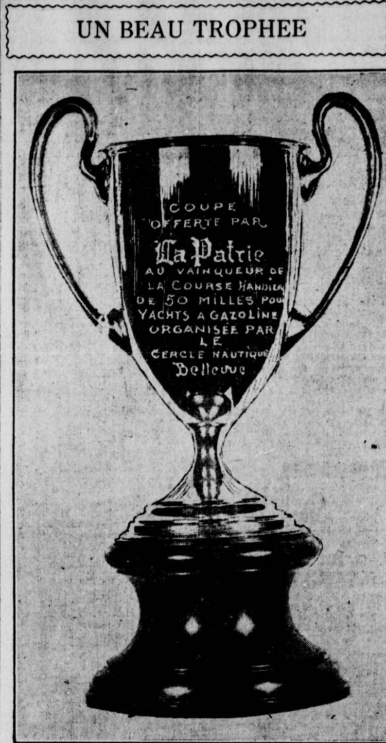
La coupe "La Patrie" qui sera décernée au vainqueur de la course en yacht de 50 milles samedi prochain à Ste-Anne de Bellevue.