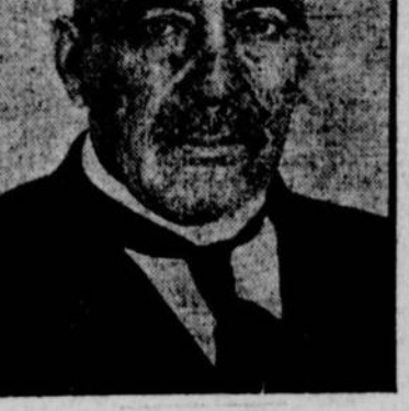
LE GENERAL HUERTA, dont le départ de Mexico, semble certain, jamais venu, et le rumeur court à ce moment-là que le général Huerta lui-même était l'homme qui devait l'occuper.

Il y a quelques semaines, une chambre avait été préparée sur le Condé pour un personnage qui n'est