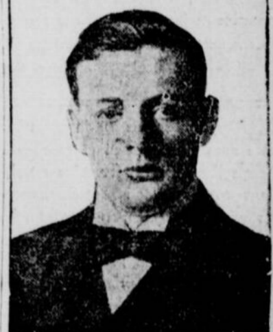
LE TRES HON. M. WINSTON CHURCHILL qui a été victime d'un accident hier.

L'automobile de Winston Churchill vient en collision avec une autre voiture et est réduite en pièces.