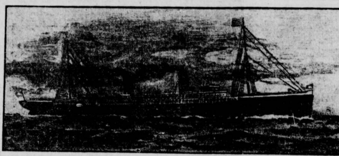
LA "GASCOIGNE" QUI S'EST ECHOUEE AU LARGE DE LA COTE DU PORTUGAL

LONDRES, 1.—Les sinistres succèdent aux naufrages avec une terrifiante fréquence. Les dépêches arrivent chaque jour annonçant un nouveau désastre sur quelque point de l'Océan. A la première heure arrivait au Lloyd une dépêche laconique, annonçant que la "Gascoigne" de la Compagnie Générale Transatlantique s'est jetée sur des récifs, au large de la côte du Portugal. La dépêche n'a pas dit connaître la position du navire et si quelque espoir est encore permis de le sauver, ainsi que ses nombreux passagers. Des navires de secours ont immédiatement pris la mer à Bordeaux et cherchent à entrer en communication par télégraphie sans fil avec la "Gascoigne" pour le localiser. La "Gascoigne" est l'une des grandes et belles unités de la Compagnie Générale Transatlantique; elle est en service sur les lignes de l'Amérique du Sud, qui relient les colonies de l'Afrique française et le Brésil, par Pernambuco et Santos, à la France.