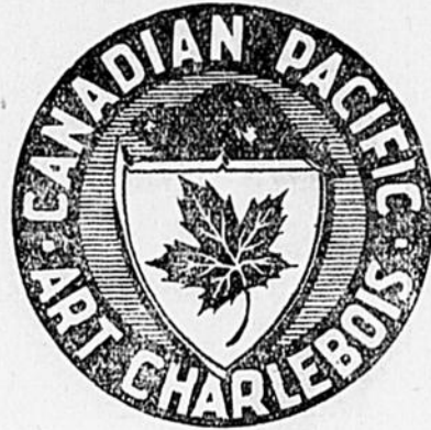
L'inscription portant le nom du mécanicien, peinte sur la locomotive.

AUCUNE nouvelle mesure introduite par le Pacifique Canadien depuis quelques années dans le but de reconnaître et récompenser les bons services de ses employés, n'a rencontré l'approbation générale comme la récente décision prise par la Compagnie, de donner aux locomotives des trains-voyageurs les noms des ingénieurs-mécaniciens qui se sont distingués, soit par le nombre de leurs années de service ou par l'accomplissement d'un acte de courage exceptionnel et qui, d'après les autorités, ont ainsi mérité cette distinction spéciale. Si cette innovation originale a réjoui les ingénieurs-mécaniciens, elle n'a pas moins intéressé le public en lui faisant réaliser jusqu'à quel point le C.P.R. apprécie ceux parmi ses employés qui contribuent à lui assurer la réputation d'efficacité générale dont il est justement fier.