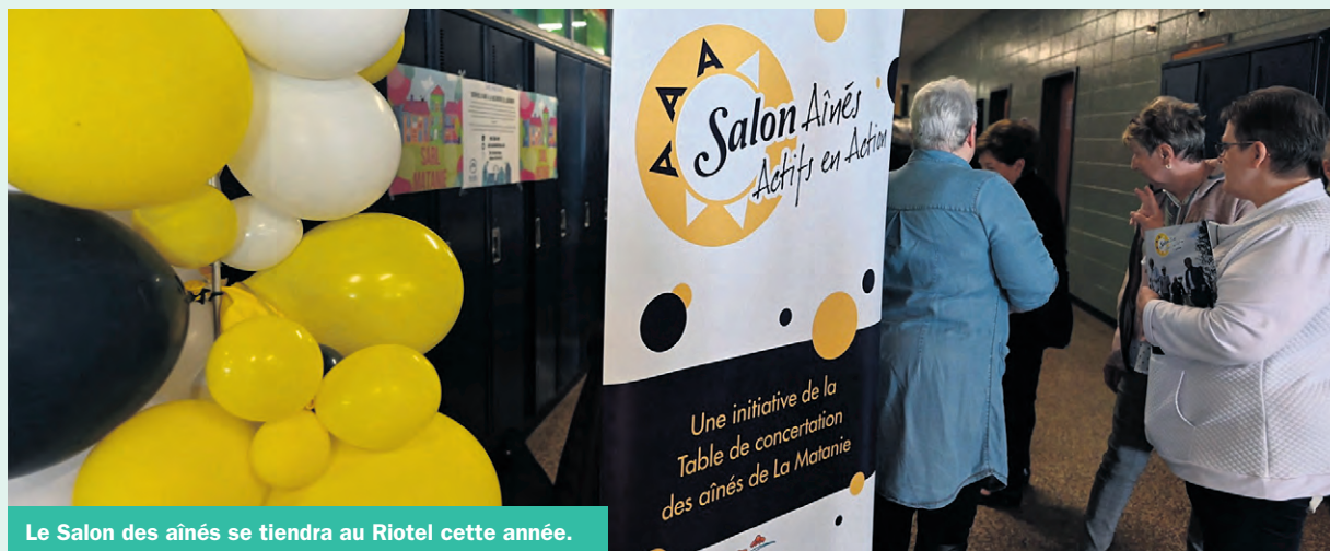
Le Salon des aînés se tiendra au Riotel cette année.

Il y a ensuite la zone créative où les participants auront l'occasion de découvrir la culture sous toutes ses formes grâce à des ateliers ludiques.