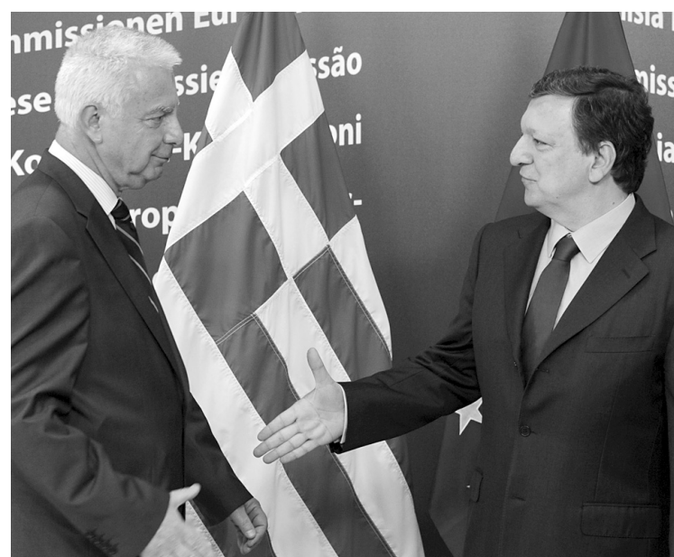
Le président de la Commission européenne, José Manuel Barroso, alors qu'il accueillait le premier ministre par intérim de la Grèce, Panayotis Pikrammenos.