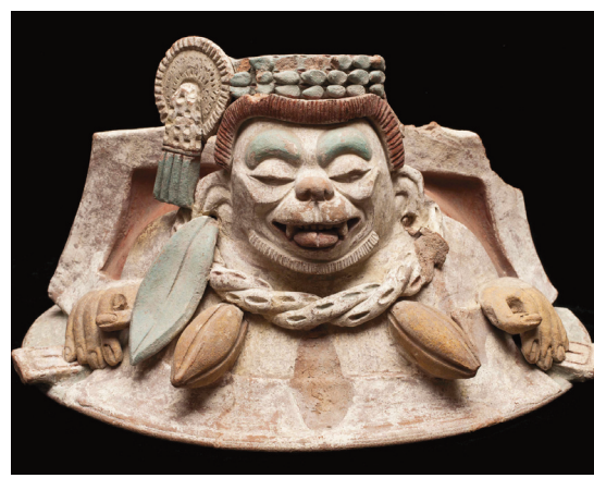
CONACULTA-INAH-MEX. JORGE VERTIZ 2011

Parmi les recherches dont fait état l'exposition figurent les plus récentes découvertes concernant la langue écrite des Mayas, à ce jour déchiffrée à près de 80 %, ainsi que leur système calendaire très élaboré. On y apprend que pour les Mayas, l'histoire de l'univers se divisait en périodes d'environ 400 ans appelées b'ak'tun . Ces b'ak'tun formaient eux-mêmes des cycles successifs de création et de destruction