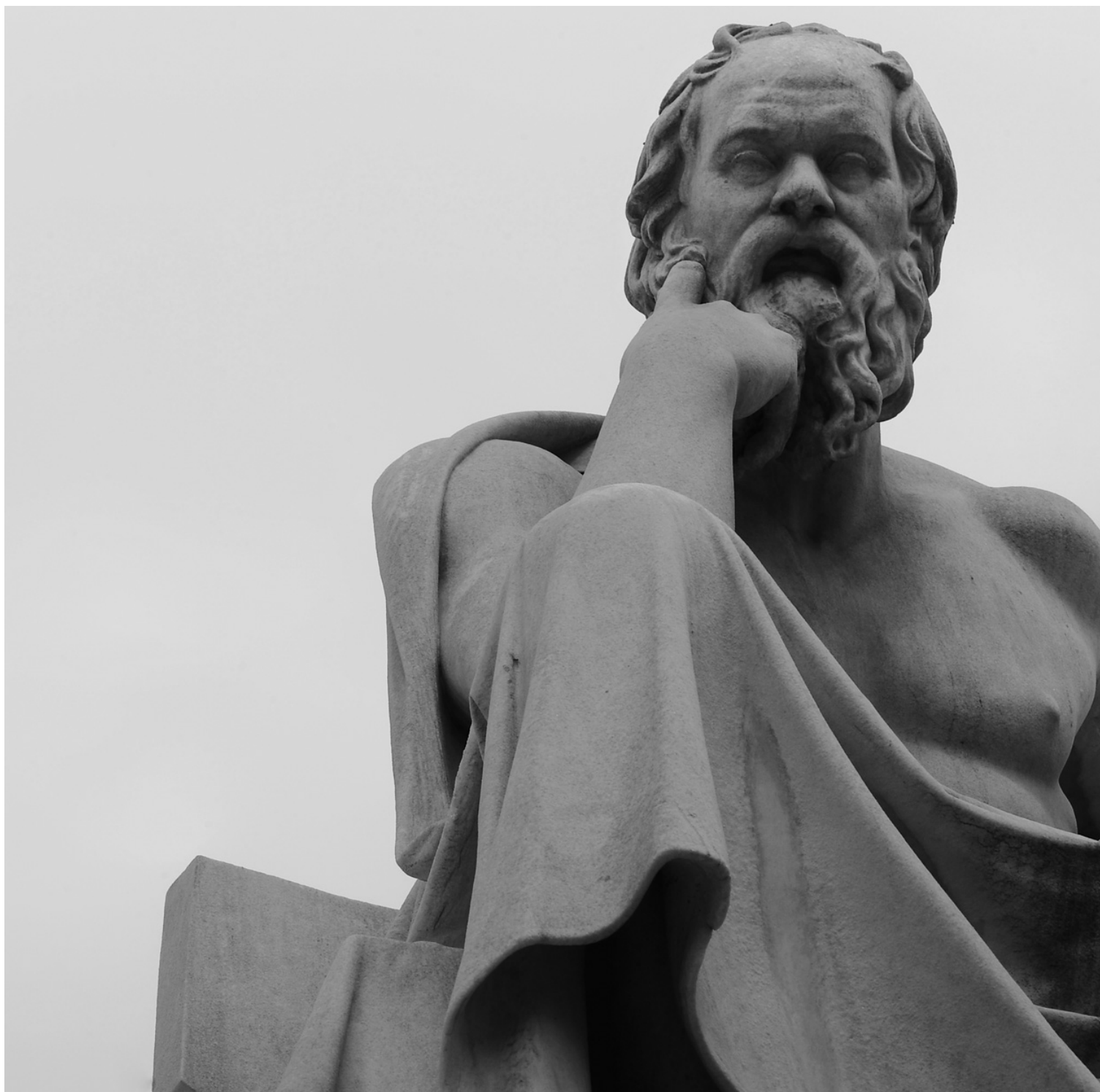
Statue de Socrate à Athènes. Rester ou partir, difficile question à laquelle les Grecs doivent répondre.

Un responsable d'un autre pays de la zone euro a tenu à minimiser. «Il n'y a pas d'un coup une consigne pour se préparer. Chacun travaille sur le seul scénario valable, la Grèce dans la zone euro», a-t-il déclaré à l'AFP. «Mais après c'est aux Grecs de choisir. Donc que chacun soit conscient que c'est une situation difficile où il faut imaginer tous les types de scénarios, c'est normal. Chacun sait ce qu'il doit faire», a-t-il ajouté. «Cela fait déjà un an