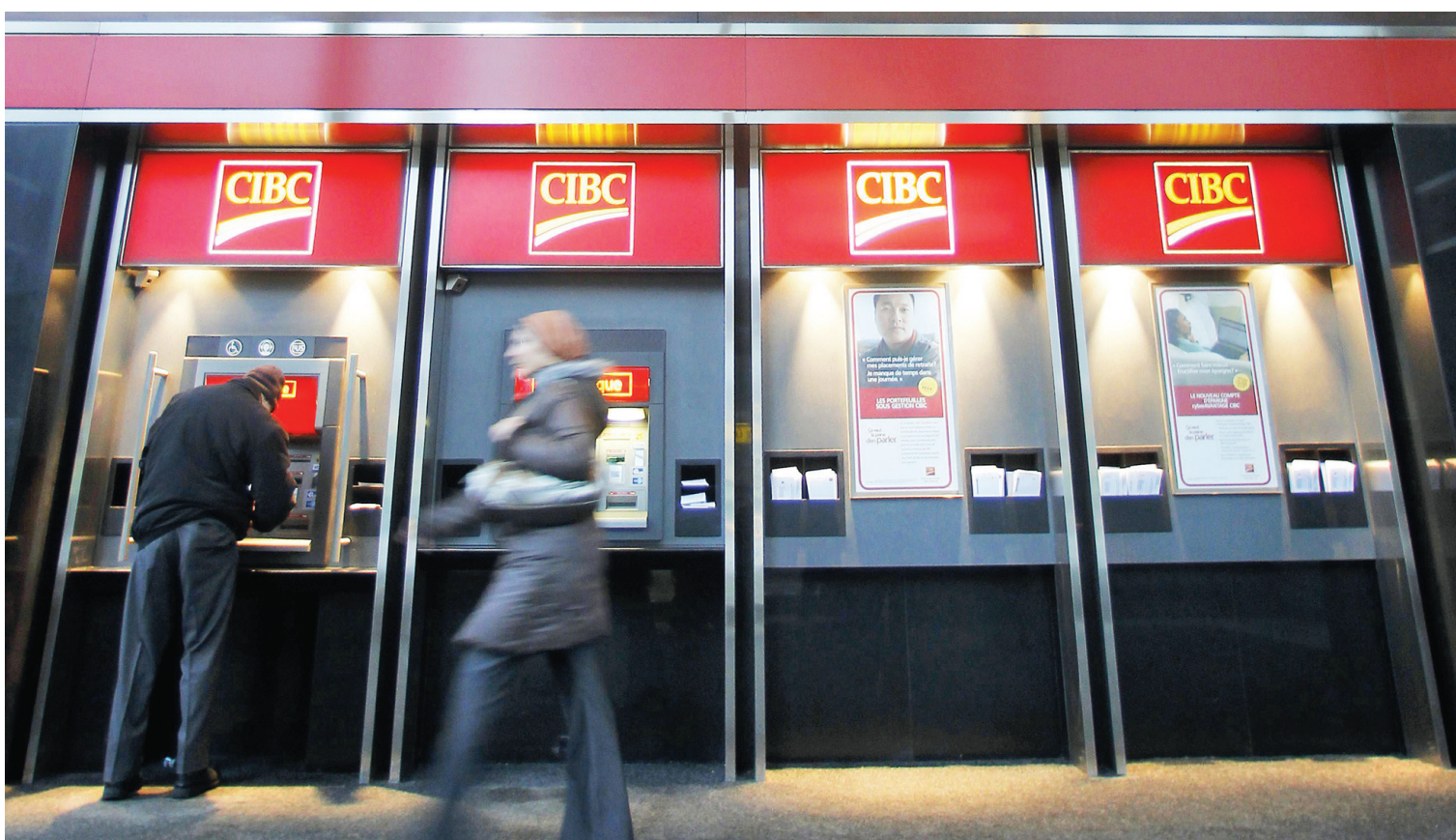
CHRISTINNE MUSCHI REUTERS

En ce moment, les banques doivent respecter la réglementation québécoise. Mais elles pourraient bien ne plus y être assujetties si Ottawa va de l'avant avec les modifications qu'il entend apporter à la Loi sur les banques.