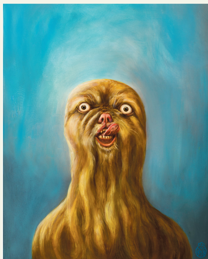
MUSÉE D'ART CONTEMPORAIN DE MONTRÉAL

Un zoo au Musée d'art contemporain. À compter d'aujourd'hui et jusqu'au 3 septembre, toute une ménagerie s'installe au Musée d'art contemporain de Montréal (MAC) à l'occasion de Zoo , une exposition réunissant 50 œuvres explorant la relation complexe qui lie l'humain à l'animal. Parmi les pièces exposées, on compte une douzaine de têtes d'animal conçues par l'artiste et dissident chinois Ai Wei Wei. Le spectre et la main , de David Altmejd, et God's Window , une installation de Trevor Gould intégrée au jardin des sculptures, ont toutes deux été réalisées spécifiquement pour ce Zoo muséal. Notre photo: Beast (highland series), de Shary Boyle (1997).