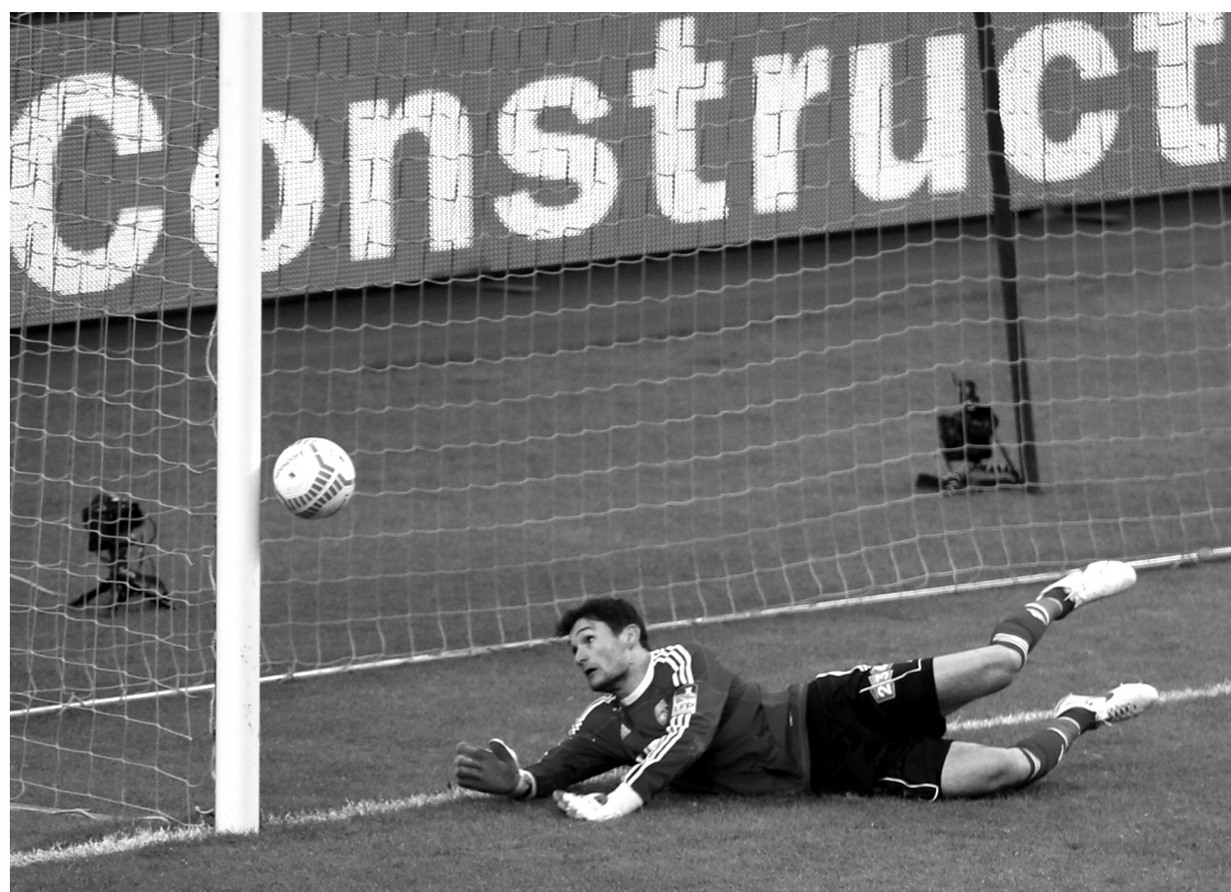
Hugo Lloris, gardien de but de l'Olympique lyonnais, un club français de première division