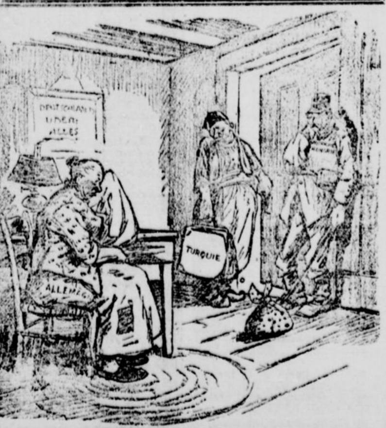
L'HEURE CRUELLE DE LA SEPARATION. (Du N. Y. World.)