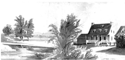
La maison des Rondeau en 1845 dans le rang Nord de la rivière Bayonne à Sainte-Élisabeth.