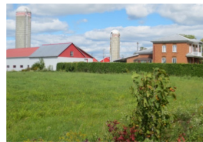
Emplacement de l'ancien cimetière de Sainte-Élisabeth aujourd'hui