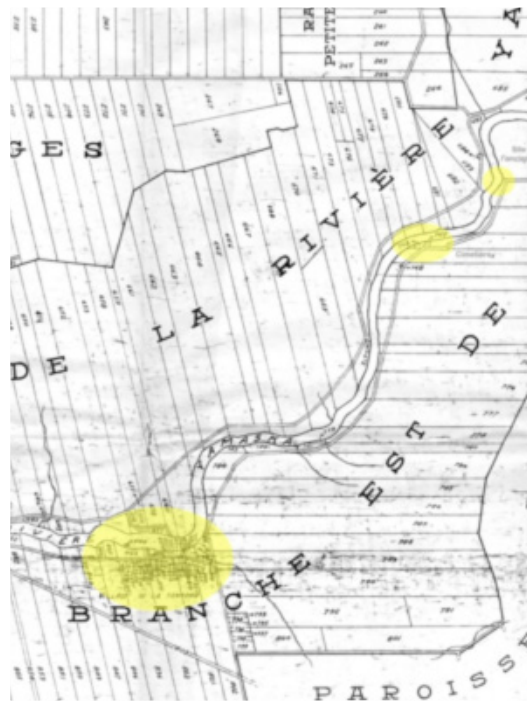
Extrait du cadastre de 1879 – Rang des Petites Allonges (au nord)