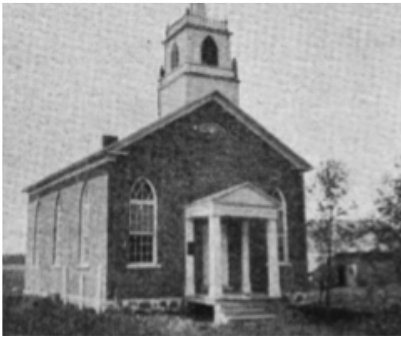
Église de Saint-Pie

dans le village de Saint-Marc d'où vient son épouse catholique et où sont nés ses enfants.) Au total 130 personnes, toutes baptistes sauf deux qui sont encore catholiques. Notons cependant que ce chiffre