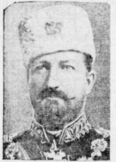
Le roi Ferdinand de Bulgarie, qui se voit obligé d'appeler aux puissances étrangères en faveur de son pays.

Londres, 22. — Une dépêche de Sofia au "Times" dit: "Dans sa réponse à la Bulgarie, le gouvernement roumain accepte la ligne Turtukal-Balchik, comme frontière définitive de la paix."