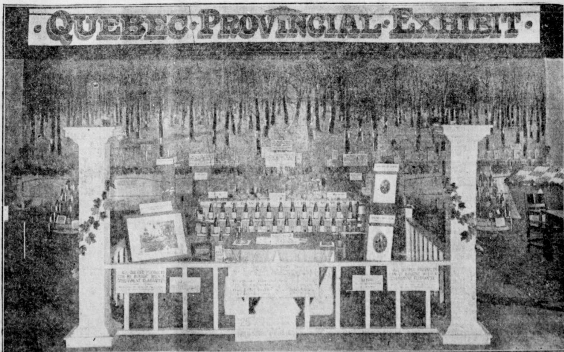
L'Exposition de la province de Québec à la récente exposition canadienne tenue à Winnipeg. Le Dépt. d'Agriculture à Québec a reçu des témoignages de félicitations particulièrement flatteurs au sujet de cet exhibit. On voit sur la photographie, au centre, des bouteilles de sirop d'érable, des pains de sucre d'érables et du tabac; le tableau, au fond, représentait une grille en temps de sucre, était fort original, empreint de couleur locale. On avait aussi installé des instruments indiquant l'ancienne et la nouvelle méthode, de faire le sirop et le sucre. C'est là seulement une partie de l'exhibit.