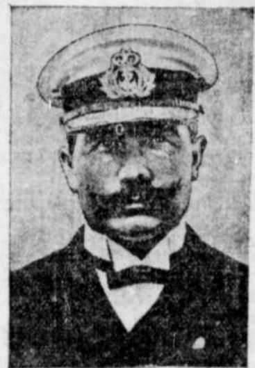
L'empereur Guillaume à qui le roi de Bulgarie fait appel pour obtenir la paix.

Londres, 22. — On ne croit pas ici que la Bulgarie se prépare à frapper un grand coup, afin de contrebalancer quelque peu l'effet de ses récentes défaites. Au contraire la Bulgarie, veut la paix et le roi Ferdinand a fait appel à l'empereur Guillaume, touchant la conduite de la Roumanie. On ne connaît pas la nature de la réponse de Guillaume.