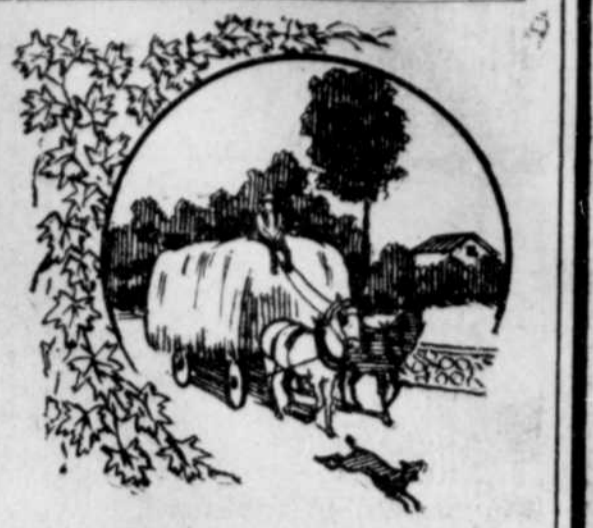
"A la ferme les travaux de la femaison sont commencés et ils ne sont point pénibles, car on songe à la riante perspective de profiter des excursions à bon marché pour aller à l'exposition de Québec."

Toronto, Ont., 22.— A sa séance d'hier, le conseil municipal de Toronto a décidé de dépenser $1,000,000 pour la construction d'un édifice et l'installation de machines destinées à la filtration de l'eau. Le tout devra être terminé dans un et demi.