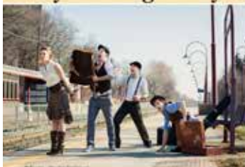
Jeudi le 20 août 2015 Jazz Manouche B.B.Q.