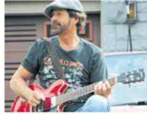
Jeudi le 23 juillet 2015 Folk-Rock Bureau et les Tiroirs