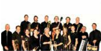
Jeudi le 18 juin 2015 Big Band La Bande à Frank