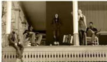
Jeudi le 25 juin 2015 Néo Trad Vent Fou