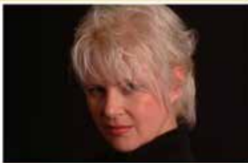
Jeudi le 6 août 2015 Jazz Mimi Mon Coeur