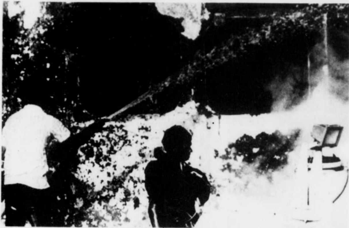
Les vedettes rapides iraniennes ont attaqué hier matin à deux reprises un cargo battant pavillon des Maldives, le Island Transporter. Un incendie s'est déclaré à bord du cargo.

Mais les deux Kim, détenteurs ensemble plus de 52 pour cent des voix, ont repoussé ses avances et laissé ouverte la possibilité d'un front unique contre le président élu.