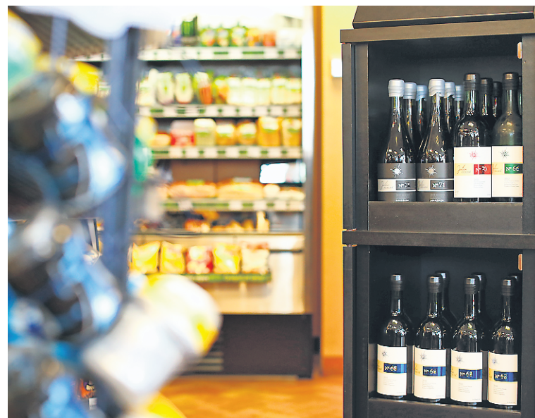
Le gouvernement a déposé hier un projet de loi qui autorise la vente des vins du Québec en épicerie et dans les dépanneurs sans passer par la SAQ. Les vignerons, les producteurs de cidre, de boissons à base de petits fruits, de miel et d'érable auront accès à ce nouveau marché.

Le projet de loi permet aux vignerons du Québec de distiller leurs rejets agricoles, comme les peaux de raisin ou les pépins, et de produire un nouvel alcool. Ce concept est déjà utilisé en Italie où les vignerons préparent un alcool appelé « grappa » avec leurs déchets viticoles. Les vignerons pourront créer une coopérative afin de minimiser le coût d'achat des équipements et de distiller au même endroit.