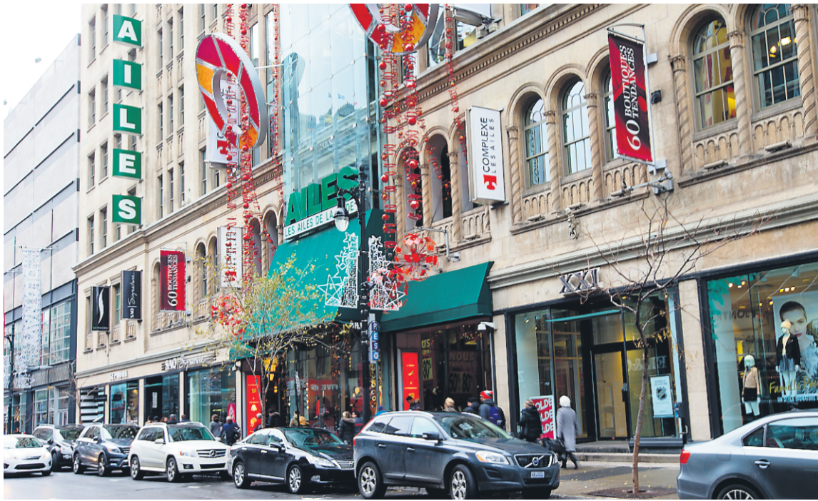
Le Complexe Les Ailes fusionnera avec le Centre Eaton voisin, nettement plus performant, et visera désormais le grand public. Les deux immeubles appartiennent à Ivanhoé Cambridge.