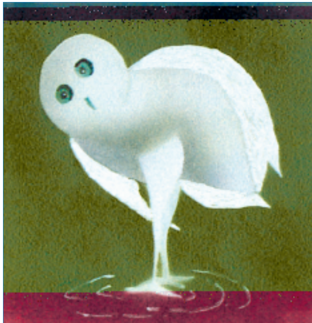
La chouette était l'animal favori de la déesse grecque Athéna, qui était considérée comme la déesse de l'intelligence et de la raison. En grec ancien, le terme « nous » désigne la faculté de penser, l'intelligence, la sagesse et, par extension, l'âme, le cœur et la volonté.

groupe et la force des mécanismes de socialisation peuvent créer l'illusion du consentement ou de l'adhésion volontaire à différentes normes ou croyances, assimilées à des « vérités » vraies qui ne peuvent souffrir aucun questionnement.