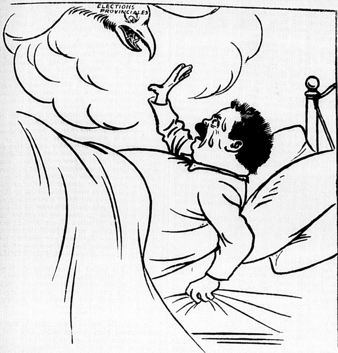
“SIR LOMER” ET LES ELECTIONS PROVINCIALES.