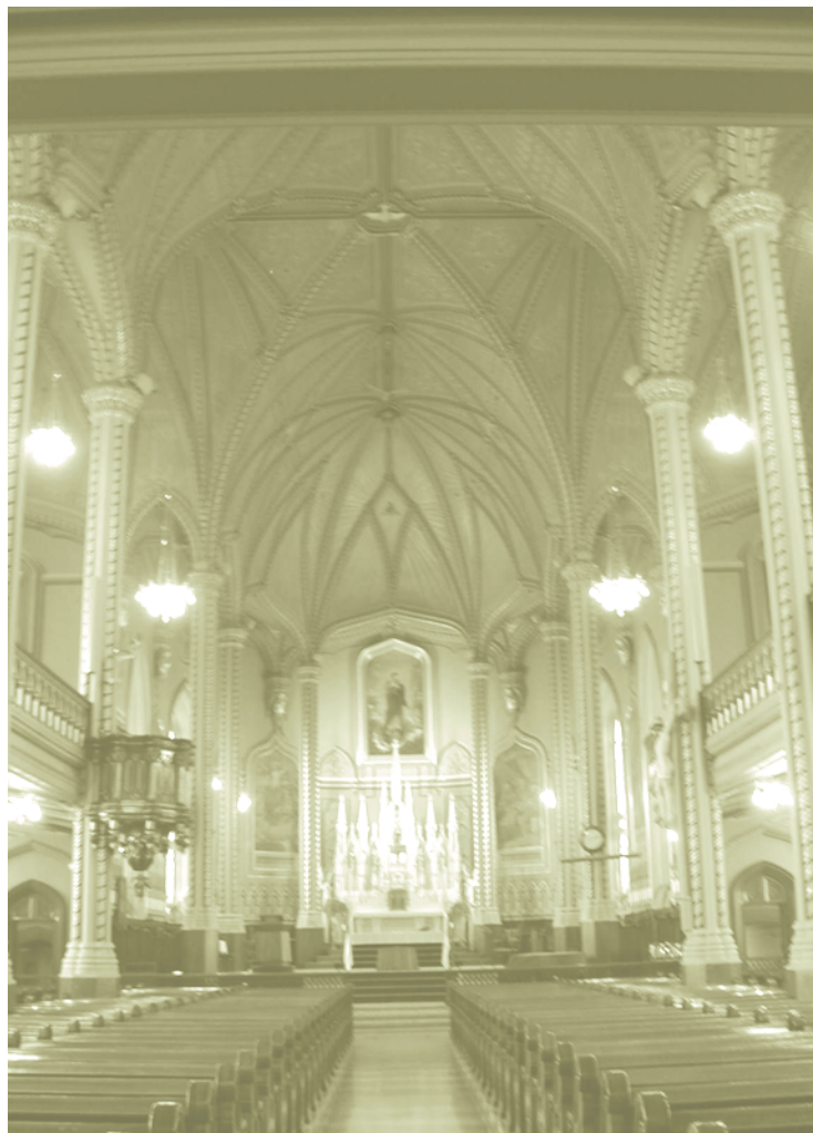
INTÉRIEUR DE L'ÉGLISE DE SAINTE-MARIE

La valeur d'art consacre le bien comme monument d'art et d'architecture parce qu'il exprime un ensemble de significations par sa configuration globale et son traitement détaillé. Cette valeur d'art peut être intentionnelle, c'est-à-dire que le créateur aura investi le bien d'un rôle d'étendard ou de témoin, ou elle