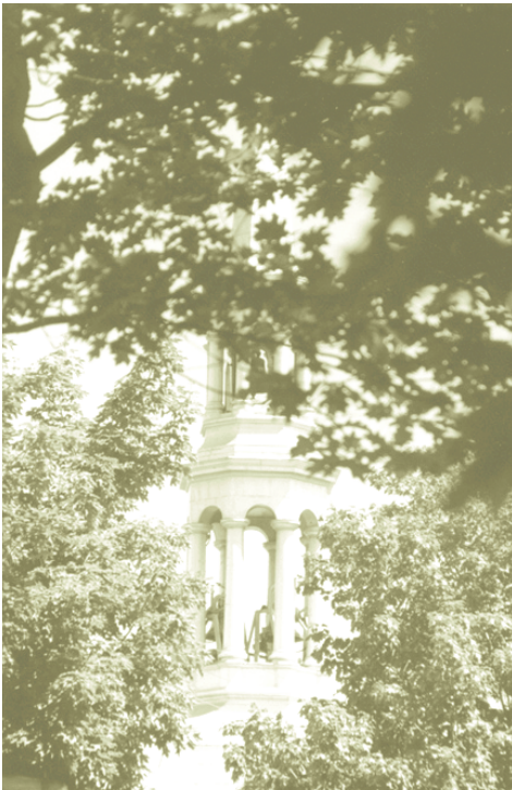
CLOCHER DE L'ÉGLISE DE BEAUMONT

plus en plus d'objets les plus signifiants d'autres traditions.