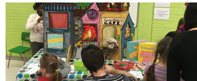
Photo: Enfants lisant les livres dans le CLAC de Nyamurenza, province de Ngozi, Burundi.

La fête des tout-petits à la bibliothèque Romain-Langlois. La bibliothèque célébrait en 2017 son 40 e anniversaire!