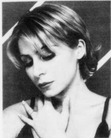
FRAGILE - Enfant chérie dans Notre-Dame de Paris où elle incarnait Fleur de Lys, Julie Zenatti propose aujourd'hui son premier album, «Fragile». Une série de chansons plutôt tendres qui plairont aux amateurs de ballades.

J'ai fait avec Passi un duo hip-hop (Le couloir de ma vie) qui ma beaucoup amusée, mais je sais maintenant que mes émotions passent mieux en ballades. Je m'y sens plus à l'aise.»