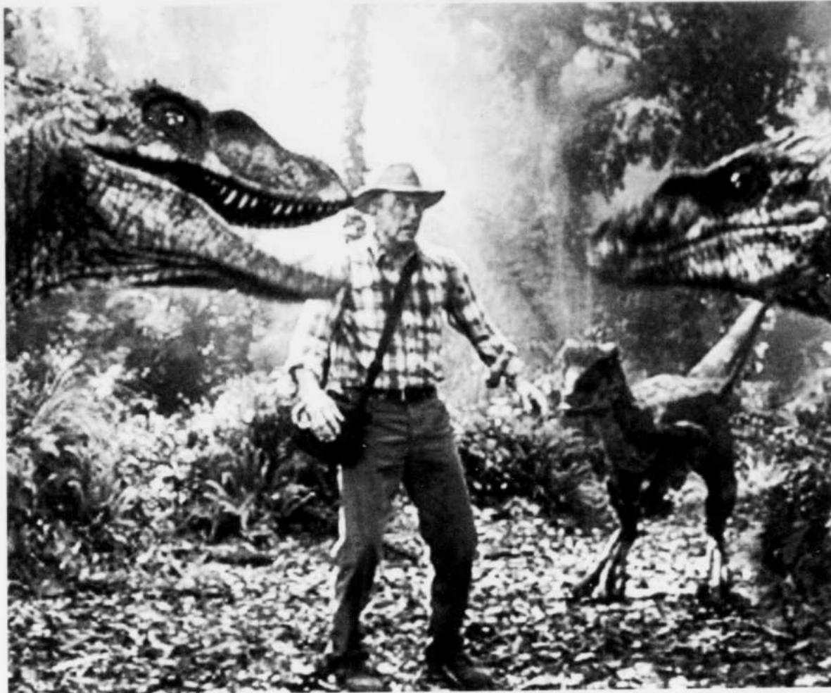
FILM - «Le Parc jurassique III», de Joe Johnston: dinosaures au menu... Ci-dessus, bien entouré par les vélociraptors, le paléontologue Alan Grant, interprété par Sam Neill.

La psychologie des personnages est réduite à sa plus simple expression, guère plus complexe en fait que celle des grands sauriens qu'ils affrontent. Le paléontologue Alan Grant (Sam Neill), celui du premier Parc jurassique, est entraîné sur Isla Sorna par un couple qui prétend vouloir simplement survoler les sites de