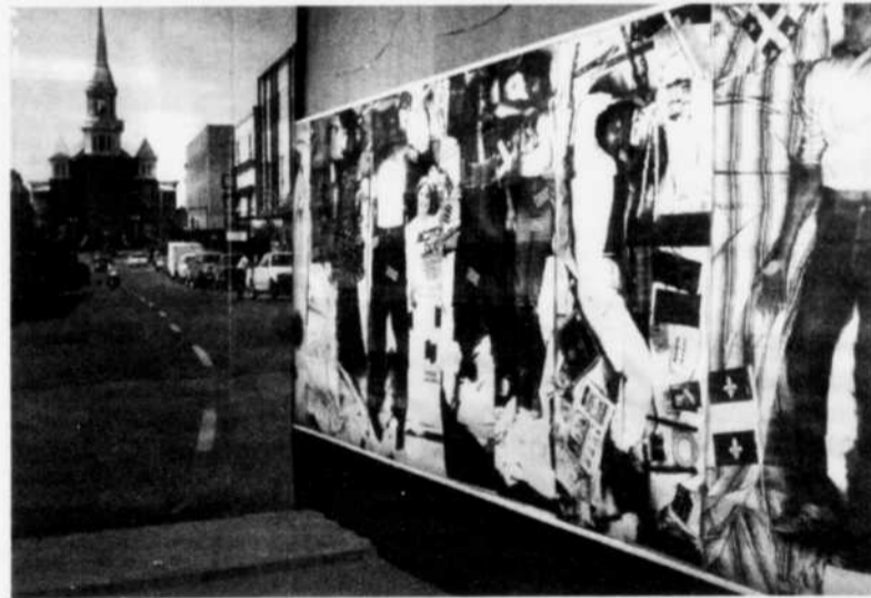
AGRANDISSEMENTS - Des agrandissements montrent, en un plein mur, l'apparence de la rue Sacré-Coeur d'il y a plus de 20 ans, à l'époque de la réalisation de la manifestation «Une rue ARTfaire», il y a 20 ans, dans le cadre des Fêtes de la Saint-Jean.

Cette salle de l'ancien hôtel de ville témoigne aussi d'une installation, au centre commercial Carrefour Alma. Les artistes y avaient utilisé du vieux pain, des invendus retirés de la