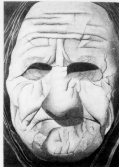
OEUVRE - Une oeuvre de Emilie Girard que l'on peut voir à la bibliothèque de Dolbeau-Mistassini.