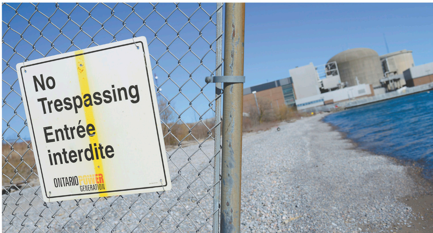
La centrale nucléaire de Pickering, appartenant à Ontario Power Generation, est située aux abords du lac Ontario.

Jointe par Le Devoir , l'attachée de presse de la ministre de la Justice a déclaré ne vouloir faire aucun commentaire avant la décision de la Cour d'appel.