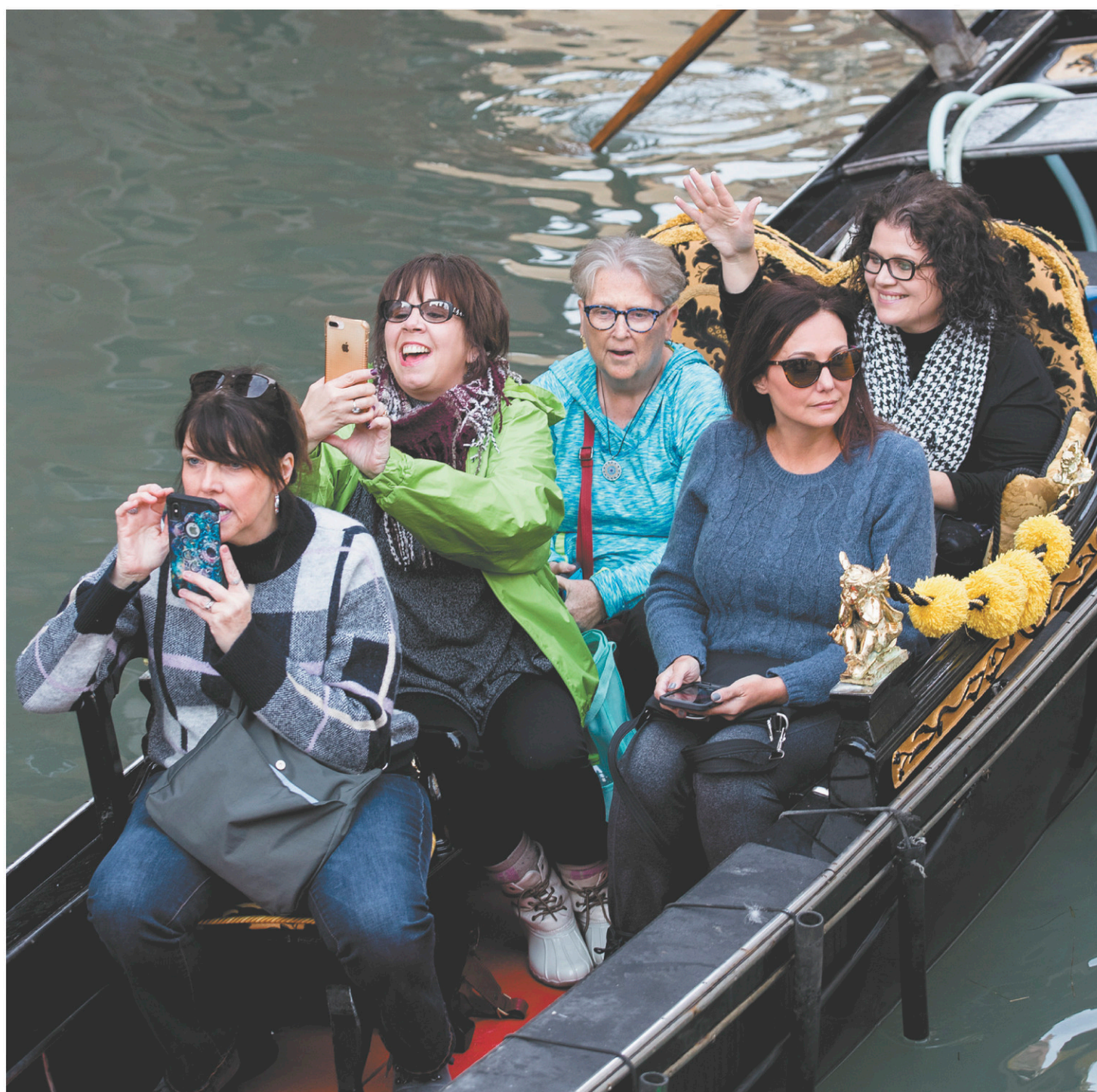
Venise croule sous le poids d'une industrie touristique qui a fait main basse sur la Sérénissime. Une situation qui force les habitants à quitter la ville mythique. Suite de notre série de reportages « En eaux troubles », sur le péril de l'eau à travers le monde. VOIR PAGE A 8 ANNIK MH DE CARUFEL LE DEVOIR