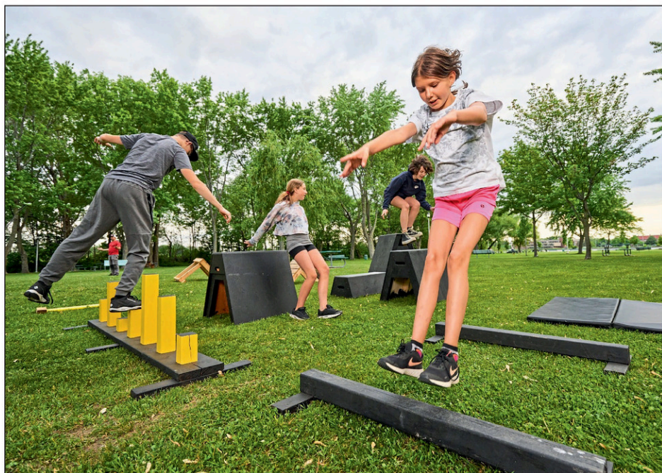
Ce centre permettra la pratique de Parkour et de Ninja Warrior.

En attendant, les installations mobiles de Parc Ékilib restent toujours disponibles pour les événements, les fêtes d'enfants, les écoles et les camps de jour. «Nous sommes tellement contents de voir l'engouement et les nombreux commentaires positifs des gens par rapport à notre projet. Nous avons vraiment hâte d'ouvrir notre centre pour transmettre notre passion pour ces disciplines sportives», de conclure Mme Crevier.