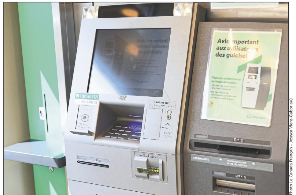
En 2022, seulement 3% des transactions ont été réalisées à un guichet automatique, indique Desjardins.

Saint-Sébastien, dans lequel sont réalisées 4800 transactions par mois, sera transféré au kiosque d'informations touristiques de Venise-en-Québec au courant de l'été.