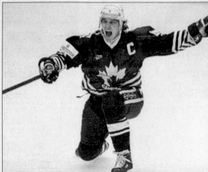
Le capitaine de l'équipe canadienne, Luc Robitaille, exulte après avoir compté, hier, contre la Finlande, le but décisif.