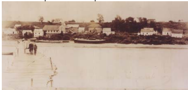
Vue du quai de Lotbinière Photo 1196

En 1693, les habitants construisent une première église (probablement une petite chapelle-église) à un endroit appelé le Domaine. C'est au cours de la construction de cette bâtisse que Mgr de Saint-Vallier, impressionné par la foi et le courage des colons, décide d'élever la mission de Lotbinière en paroisse le 27 septembre 1724.