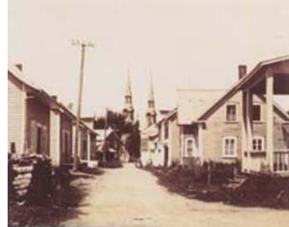
Rue de Viller, vers 1940 Photo 1210

Le développement de la seigneurie s'est fait peu à peu en commençant par le rang du bord de l'eau pour ensuite s'étendre dans les terres. Ainsi, la paroisse de Lotbinière est devenue la mère de Saint-Édouard et de Sainte-Emmélie de Leclercville (maintenant Leclercville) et la grand-mère de Saint-Edmond-de-Val-Alain (Val-Alain) et de Saint-Janvier-de-Joly (Joly).