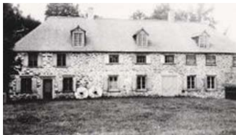
Moulin du Portage avant l'incendie