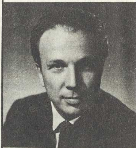
L'HONORABLE JEAN-PIERRE GOYER

Le Conférencier au déjeuner-causerie, du MARDI, 30 MARS