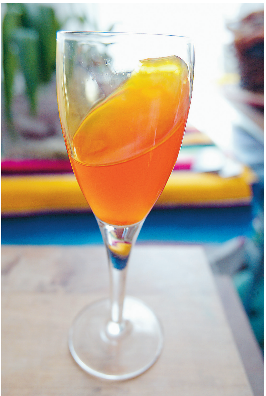
Infusion de safran à l'iranienne