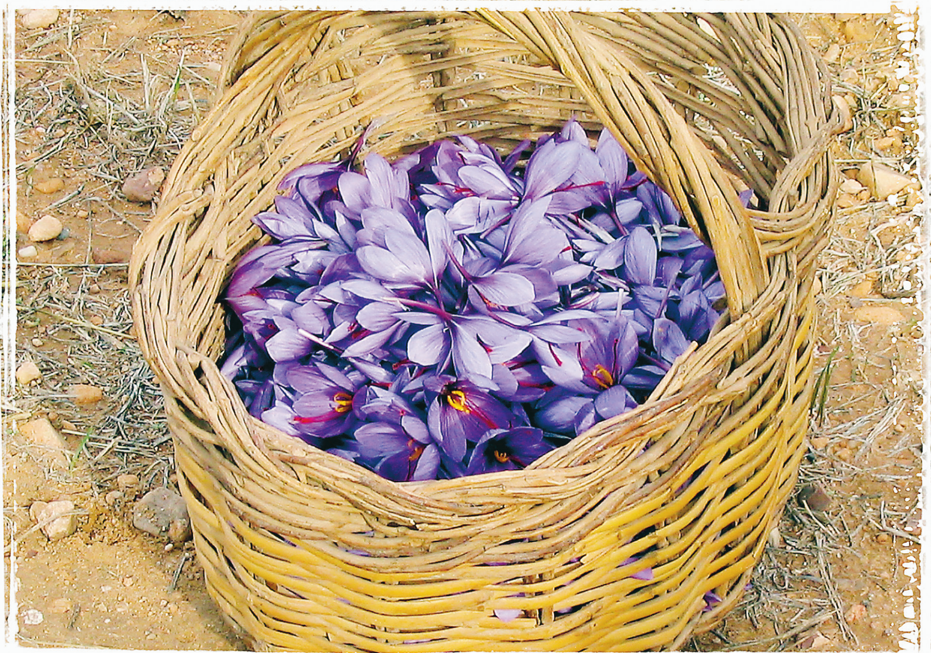
Les pistils de ces crocus fraîchement cueillis dans la région de Castilla-La Mancha en Espagne, deviendront en séchant ce qu'on appelle le safran.

La région de Castilla-La Mancha au centre de l'Espagne est connue pour trois choses : c'est le pays de naissance du réalisateur Pedro Almodovar, c'est le pays où Don Quichotte a eu ses visions, et c'est le lieu de culture de la plus chère de toutes les épices du monde, le safran. Rencontre avec la poudre d'or.