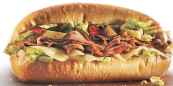
Bœuf et provolone