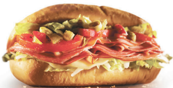
Gourmet à l'italienne