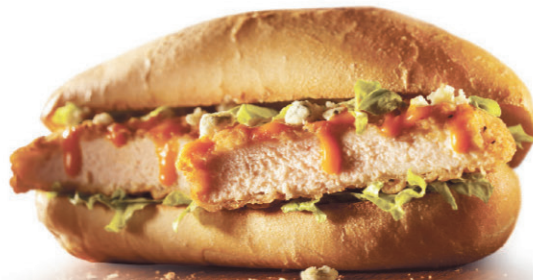
Poulet croustillant à la Buffalo