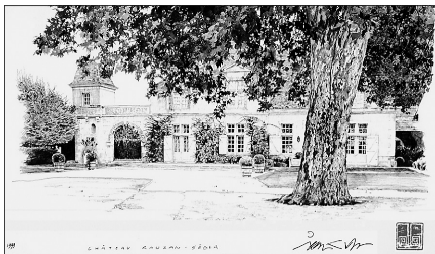
Le Margaux Château Rauzan-Ségla, vu par le designer montréalais Jean Gladu.

Vins amples, au boisé très bien marié au fruit, ce sont les trois derniers — les plus jeunes, aux saveurs pleines d'éclat — qui m'ont semblé les plus séduisants.