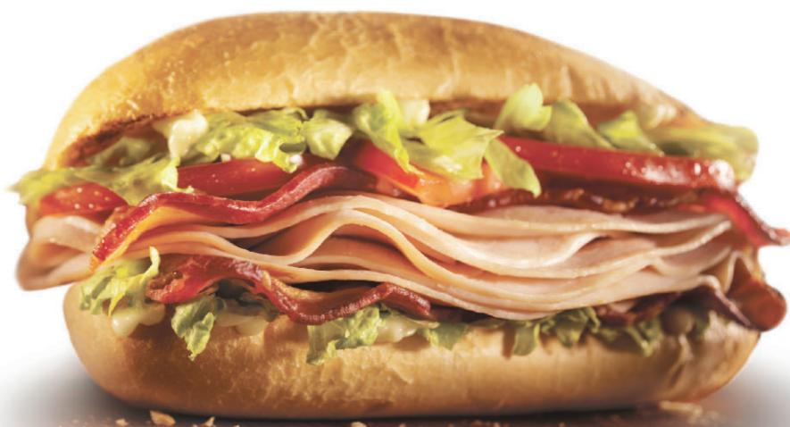
BLT à la dinde