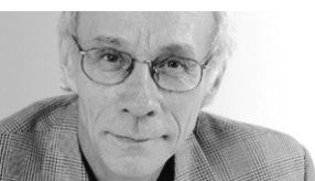
JACQUES BENOIT DU VIN

Créé au Québec il y a moins d'une quinzaine d'années, le cidre de glace s'est hissé au tout premier rang des produits artisanaux.