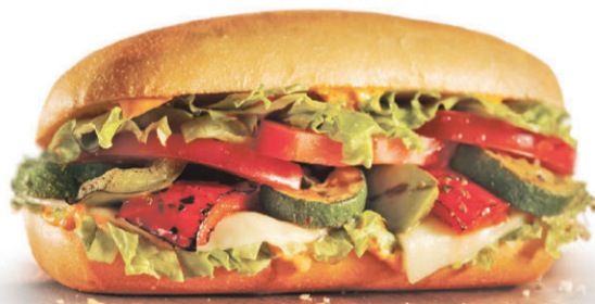
Légumes grillés et fromage fondant†