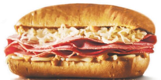
Reuben à la new-yorkaise

McDonald's® vous présente ses six nouveaux Sandwichs déli sur pain grillé. Fraîchement préparés sur commande, ils sont tous servis sur un petit pain grillé chaud de votre choix et garnis d'ingrédients de qualité comme de savoureuses charcuteries, des légumes grillés et une variété de fromages. Commandez-en un dès aujourd'hui à notre service-au-volant.