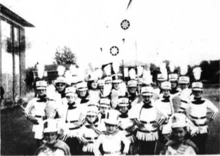
Le corps de marjorettes de Thurso fait savoir qu'elles ont repris leurs activités et que toutes celles qui désirent en faire partie sont priées de communiquer à 985-2127, 985-2991 et à 985-2516.