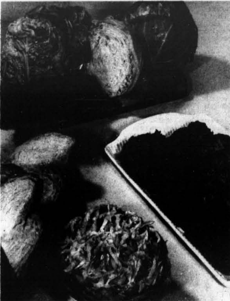
Le chou est délicieux, nutritif et peu dispendieux. Le chou en quartiers, servi comme légume et la salade de chou sont populaires, mais les adeptes des "cigares au chou" sont encore plus nombreux.

D'après les enregistrements compilés au cours de six premiers mois de 1966, on estime que le total des enfants du groupe 0-4 ans atteindra 629, 142 durant l'année, et qu'en 1971, ceux-ci seront remplacés par 626, 351 autres du même groupe d'âge. Cette légère diminution, au plutôt cette stabilisation du nombre total des naissances, permet d'envisager la possibilité d'une réduction, des investissements destinés aux écoles primaires, aux maternités et aux cliniques pour enfants.