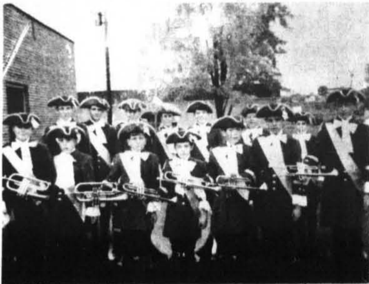
Les cadets de Thurso désirent augmenter leurs effectifs à une quarantaine de membres. Tous les intéressés et même ceux de l'extérieur ayant de 13 à 18 ans, devront se rendre à l'École Monseigneur Desrosiers les lundi et mercredi soir pour 7 heures 30 ou communiquer à 985-2886. Les cadets font partie des loisirs de Thurso.