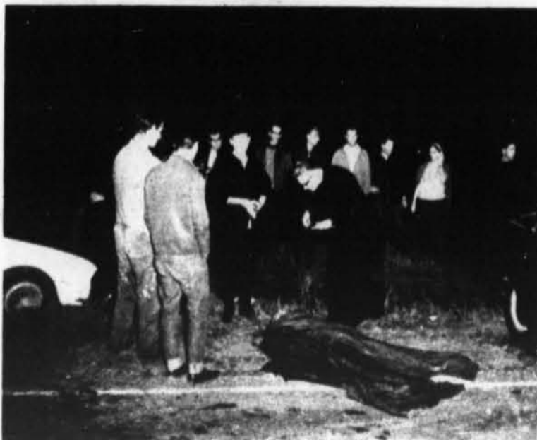
Les trois photos ci-haut indiquent bien l'ampleur de cette tragédie au pont d'Aragon.