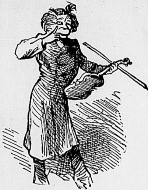
Question à "La Patrie."

La Patrie qui dans son numéro de samedi dernier se montre si chatouilleuse sur le point d'honneur et qui accuse le rédacteur du Violon d'avoir mangé à toutes les crèches, etc., peut-elle nous dire le nom de l'individu qui a pris la poudre d'escampette de Berthier, il y a une quinzaine d'années, dans des circonstances sucepissémastiques ? Nous attendons sa réponse.