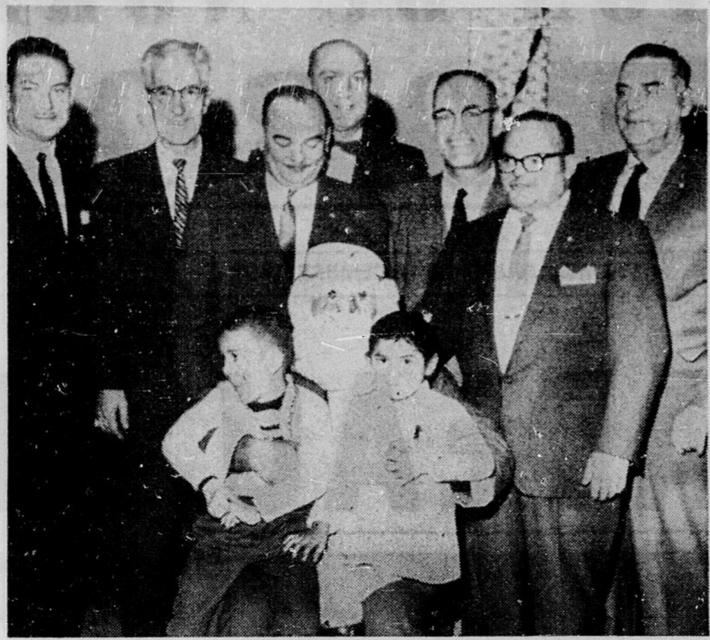
LE PERE NOEL a visité les enfants infirmes de la région de Sturgeon Falls...