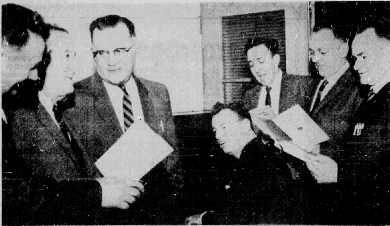
LA COMMISSION DES PARCS de Sudbury se réunissait, lundi soir, pour tenir sa soirée annuelle de Noël. Naturellement, l'un des principaux items de la soirée fut le chant des hymnes de Noël. Nous voyons, dans la photo, entourant le