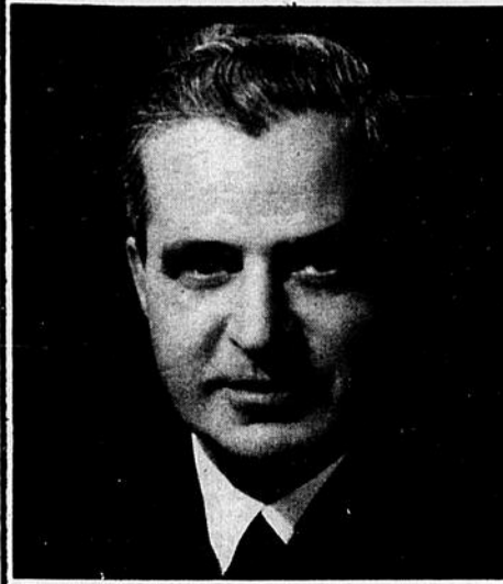
HON. JEAN-JACQUES BERTRAND