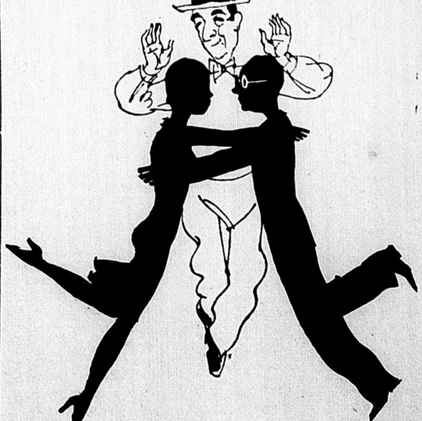
UN DESSIN AMUSANT REPRESENTANT RAIMU qui unit les deux amoureux de "LA PETITE CHOCOLATIÈRE", Jacqueline Francell et Pierre Bertin. Cette joyeuse comédie est à l'affiche du Cinéma de Paris.