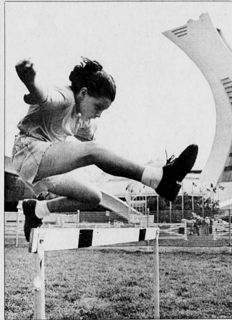
Une jeune fille tente sa chance à la course de haies, l'une des disciplines olympiques auxquelles 15 000 badauds se sont initiés au Parc olympique, hier.