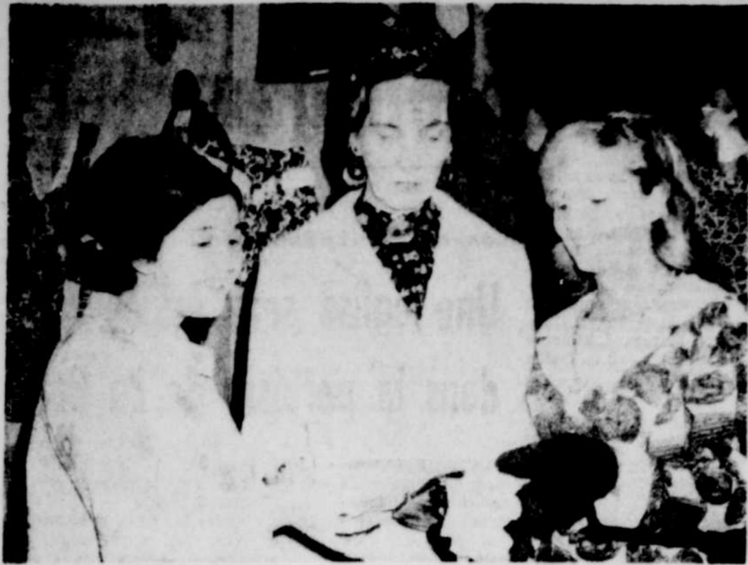
IL SUFFIT de se rendre au sous-sol du Centre Culturel de la rue Ringuet pour admirer les nombreuses pièces d'arts familiaux et plastiques exécutés par les élèves de la commission scolaire locale, depuis la 4e année jusqu'à la 7e année, et qui sont en montre pour prouver aux parents des élèves, jusqu'à quel point on peut développer de nombreux talents