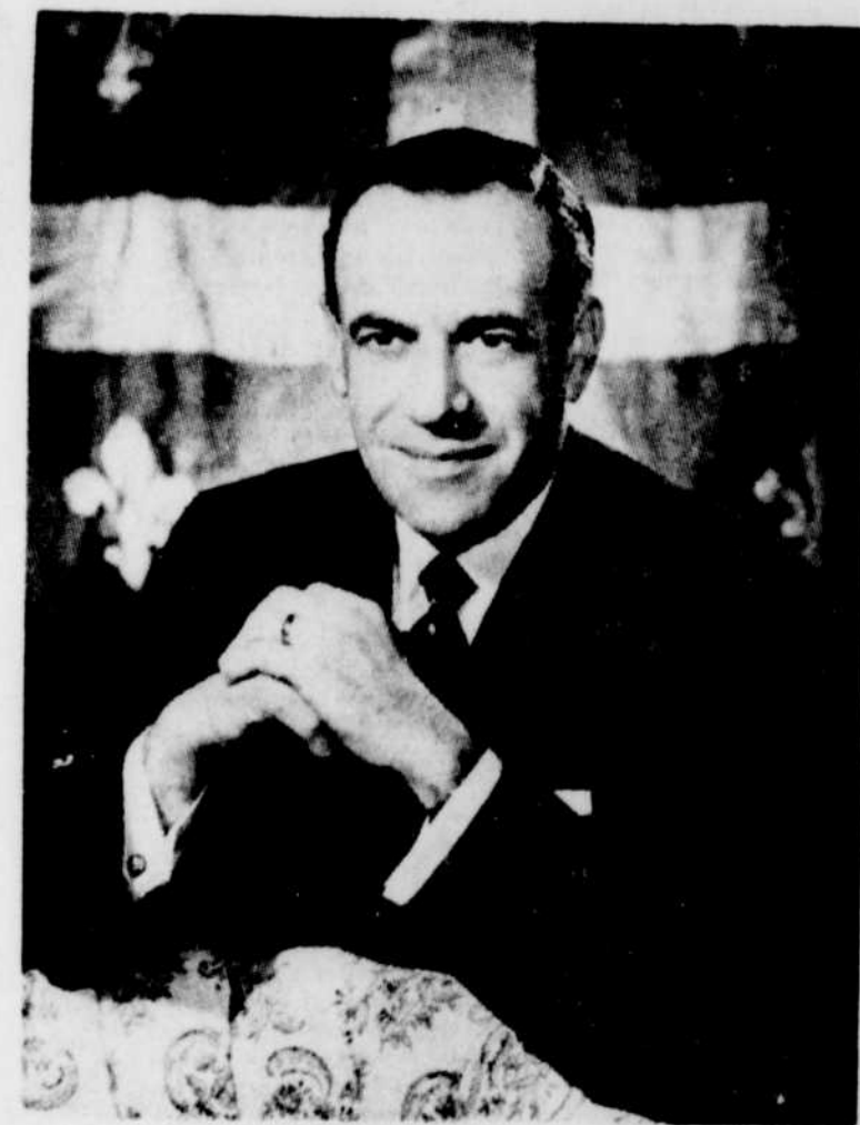
Hon. Yves Gabias

Nous vivons dans une période de grande évolution sociale. Et ce Centre Culturel en marque le point. C'est un moyen de plus mis à la disposition de toute la population pour l'enrichissement de chacun. Profitons-en au maximum, c'est à notre avantage.