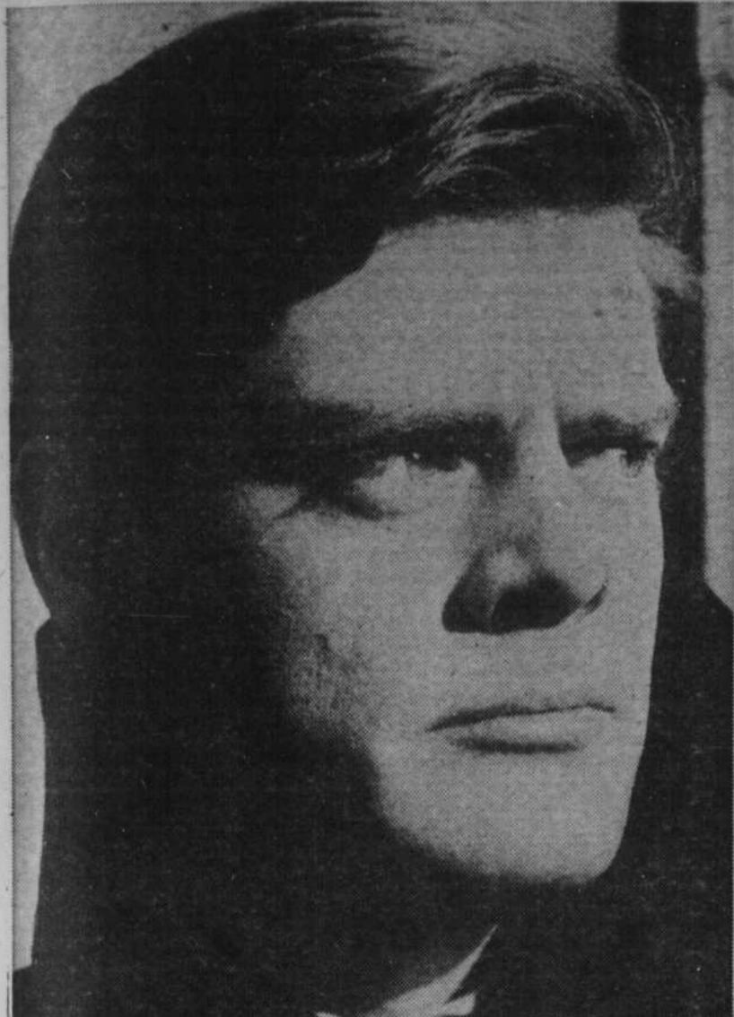
le regard dur et anxieux de celui qui cherche...