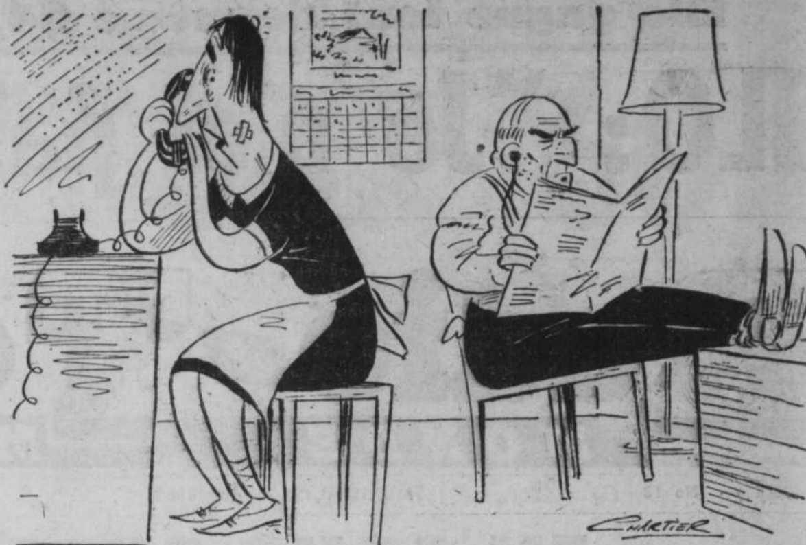
"C'est pas drôle d'avoir un mari jaloux, ma chère. C'est pas vivable ! Imagine-toi qu'il ne veut plus que je voie GUY PROVOST... notre télévision est fermée depuis un mois !"