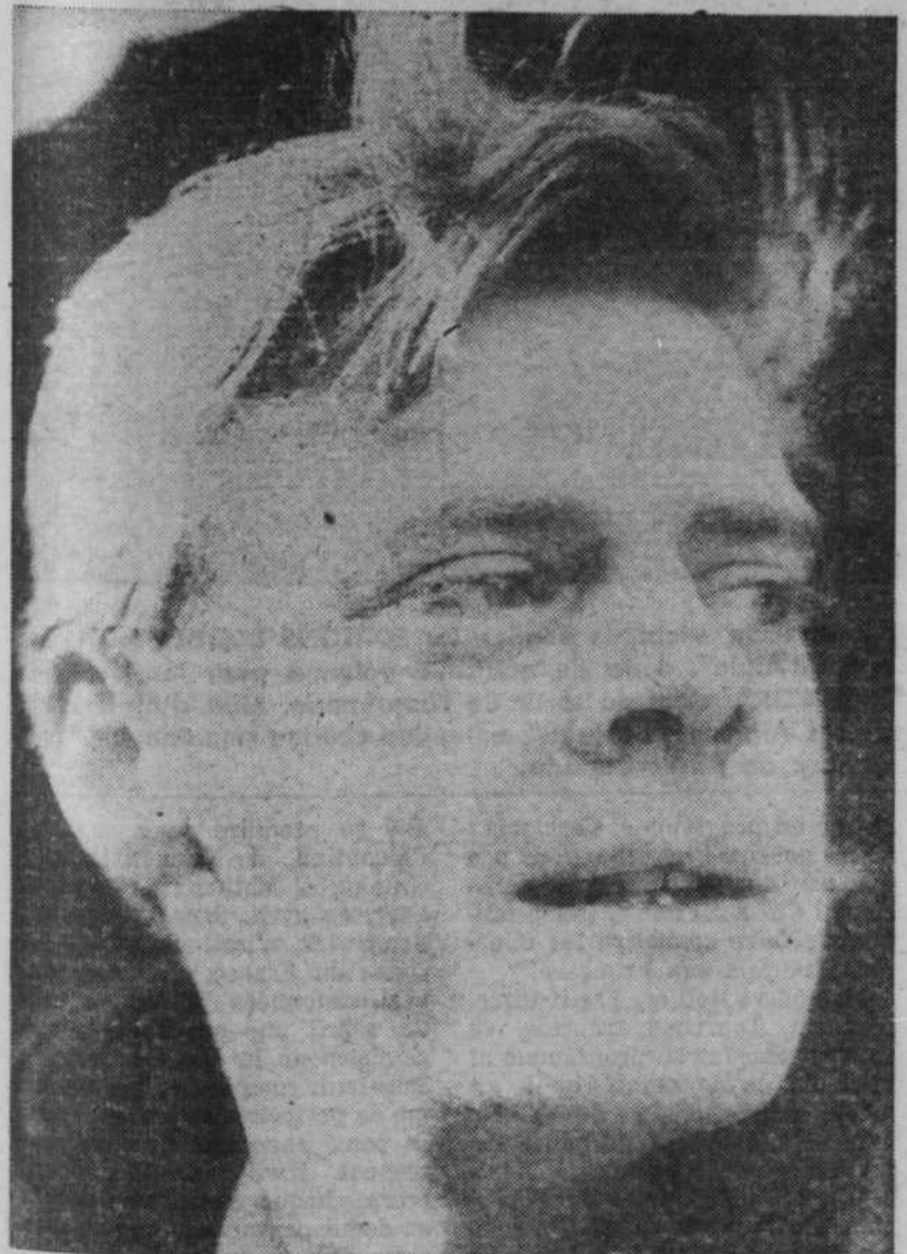
... à celui, tendre et souriant, d'un "Bobino" lunaire.

Pour les enfants, c'est un personnage : Bobino.