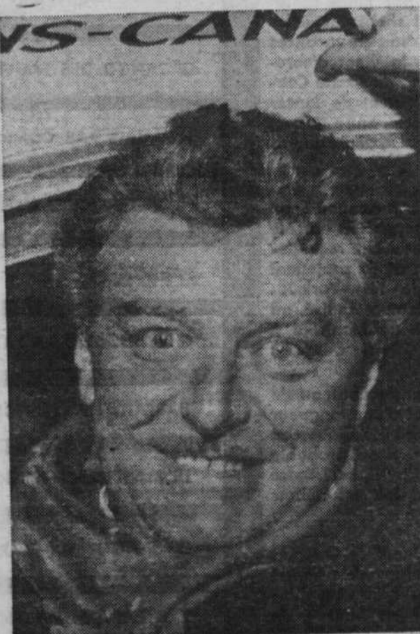
Et Genest aussi est content; la guigne semble vouloir le lâcher.