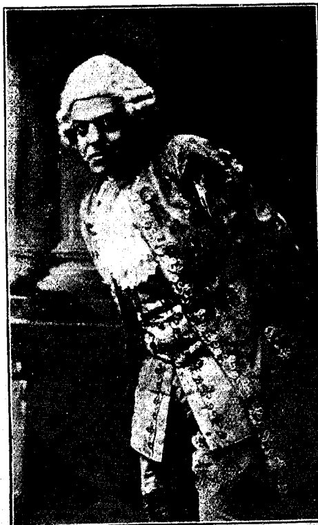
PALMIERI—Rôle de Maurin

MAURIN (ricanant).—Et voilà les naïvetés que l'on enseigne chez les Jésuites... Hé! Madame, voilà des grands sentiments qu'on ne soupçonnerait pas d'une femme transportée à la Louisiane avec des prisonniers de l'Etat. (Mme d'Hastrel chancelle et tombe fauteuil à droite,