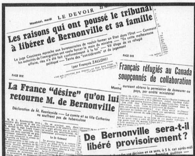
Les journaux de l'époque, dont LE DEVOIR, donnaient des indications précises sur les accusations portées et les condamnations à mort prononcées outre-Atlantique contre les collaborateurs français entrés au Canada.

Pour les nationalistes de la vieille école fortement influencés par la pensée maurassienne, le nationalisme libéral des années 1960 prend l'allure d'une véritable apostasie.