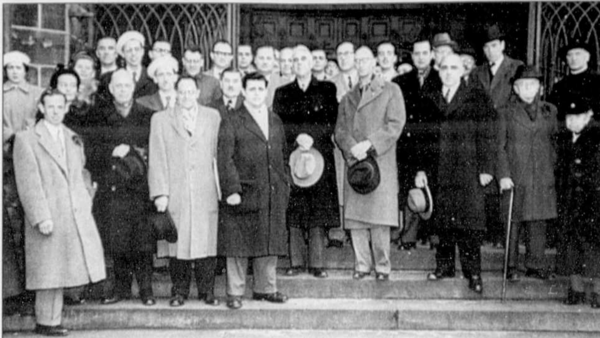
Un groupe d'admirateurs du maréchal Pétain qui venait d'assister à une messe en sa mémoire à l'église Notre-Dame à Montréal, en novembre 1951.