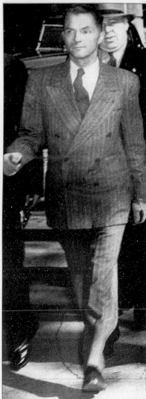
Jacques Dugé, comte de Bernonville. Membre de la Milice, celui-ci était entré illégalement au Canada en 1946. Il fut au centre d'une tempête politique au Québec entre 1948 et 1951.

Tous ces gens, jeunes et moins jeunes, connaissaient-ils le poids des accusations qui pesaient en