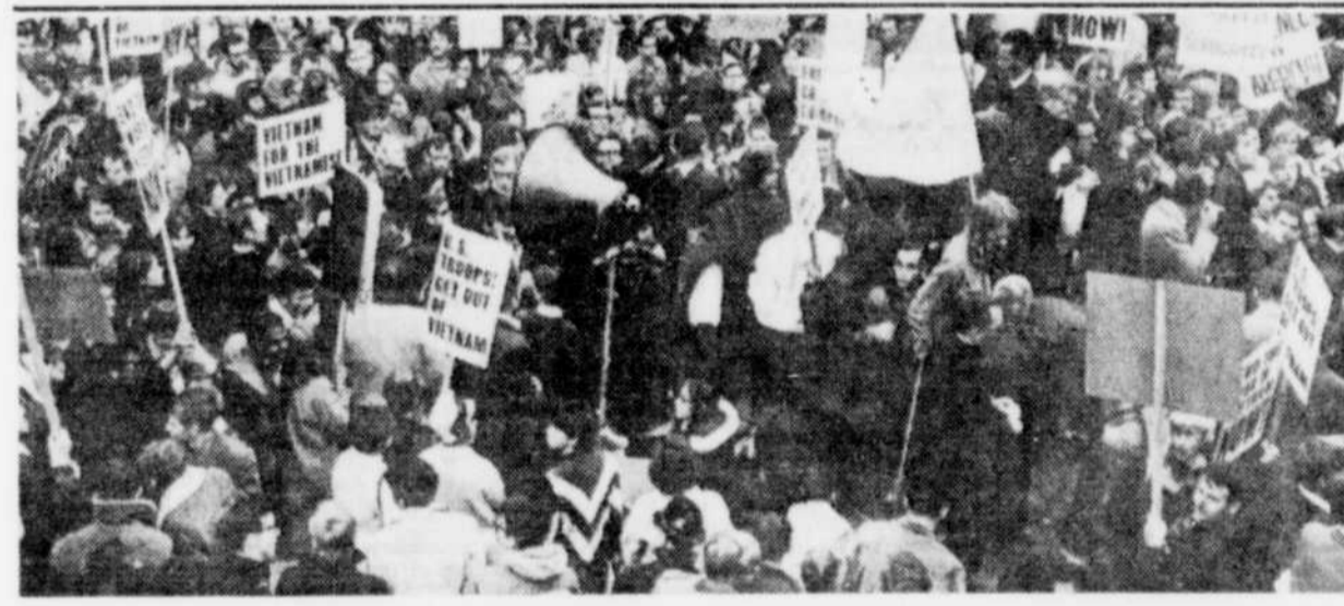
Une manifestation "classique" contre la guerre au Vietnam...

Le taux de la taxe de locataire, commerciale et résidentielle a été maintenu à respectivement 8 et 6 pour cent de la valeur locative. Il en est de même de la taxe spéciale de $0.50 du pied linéaire imposée aux personnes qui construisent des immeubles dans des zones nouvelles.