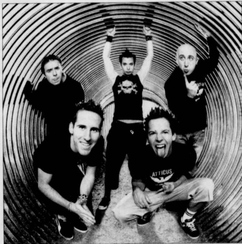
Les membres du groupe montréalais Simple Plan

Chez les autres Québécois, les Montréalais Rufus Wainwright (album adulte alternatif de l'année pour Want Two ), The Arcade Fire (album alternatif de l'année pour Funeral ), Stars (album alternatif de l'année pour Set Yourself on Fire ), Susie Arioli Band