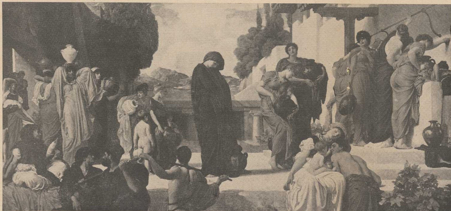
"ANDROMAQUE CAPTIVE" Oeuvre de Frederic, Lord Leighton of Sketton