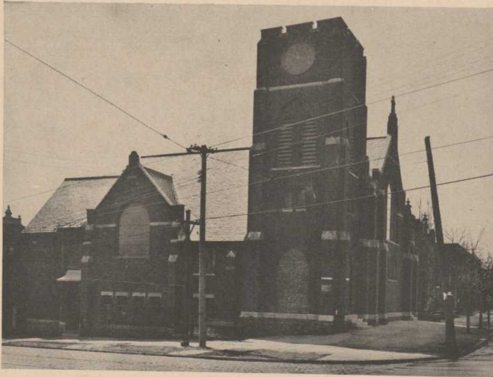
Le Centre Dramatique des Compagnons, angle Sherbrooke et Delorimier. Nous y installerons une scène, une école d'art dramatique et la "maison" des Compagnons.