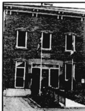
Ormstown et Saint-Malachie occupent le même hôtel de ville depuis quelques années.

Les deux municipalités ont favorisé le rapprochement, plus tôt cette année, en concluant des ententes pour le partage de services et la mise en commun de projets municipaux. Par ailleurs, Ormstown et Saint-Malachie occupent le même hôtel de ville depuis quelques années.