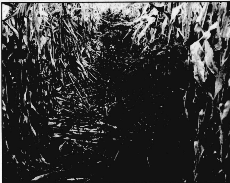
Comme en témoigne cette photo, les champs de maïs recèlent parfois des plants de marijuana qui sont semés au printemps à l'insu des agriculteurs.

La GRC est très sensibilisée à ce problème. Elle a d'ailleurs produit un document à l'intention des producteurs agricoles afin d'adopter des mesures à suivre lors de la découverte de culture de marijuana. La meilleure attitude à adopter est d'informer la GRC ou la Sûreté du Québec, et d'éviter toute intervention personnelle sur le site car les gens n'hésitent pas à protéger leurs marchandises et certains producteurs pourraient être l'objet d'agressions, lit-on dans le document qui est disponible au bureau de l'UPA.