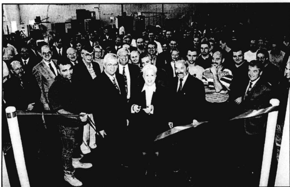
La ministre Louise Harel a profité de sa visite à Valleyfield, le 11 septembre, pour annoncer l'octroi de 118 500 $ pour aider à la formation professionnelle en techniques d'usinage à l'Atelier d'usinage Meloche.

Enfin, la ministre est venue confirmer l'octroi d'une aide financière de 70 000 $ pour la création d'emplois liée à la réouverture de l'ancien canal de Beauharnois, un projet du plan directeur de développement touristique de Valleyfield. L'étude de faisabilité en cours porte sur la mise en valeur de l'ancien canal de Beauharnois et un concept d'aménagement des terrasses.