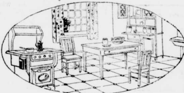
UN COIN DE LA CUISINE

don. Qui, le premier eut conscience et le souhait, distribuait à leurs belles pitie d'une aussi sombre détresse? Je l'ignore, mais pour cette pensée de délicate charité, il mérite d'être loué et remercié. Désormais, en des lettres parfois touchantes de naïveté, l'isolé pourra dire sa tristesse, oser exprimer ses désirs, sûr que l'on compatira à cette peine, que l'on aidera à la réalisation de ces désirs. Lui compatira à cette peine, que l'on aidera à la réalisation de ces désirs. Lui aussi recevra enfin, avec un plaisir un peu enfantin, le colis ou le tabac voisin avec les lainages, et où, plus que de raison, le chocolat s'imprègne d'un relin de savon.