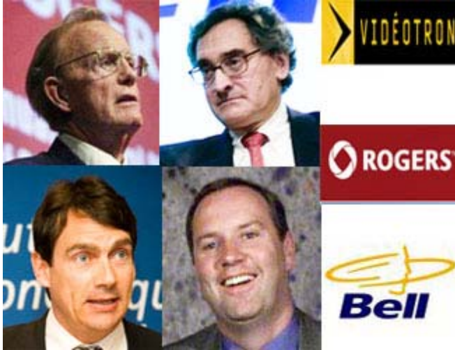
Ted Rogers, Michael Sabia, Pierre-Karl Péladeau et George Cope

Alors que le géant Bell Canada a été durement attaqué par Videotron, Telus et Rogers durant les dernières années, voilà que le nouveau président, George Cope, s'est fixé comme mandat de ramener l'empire au premier rang.