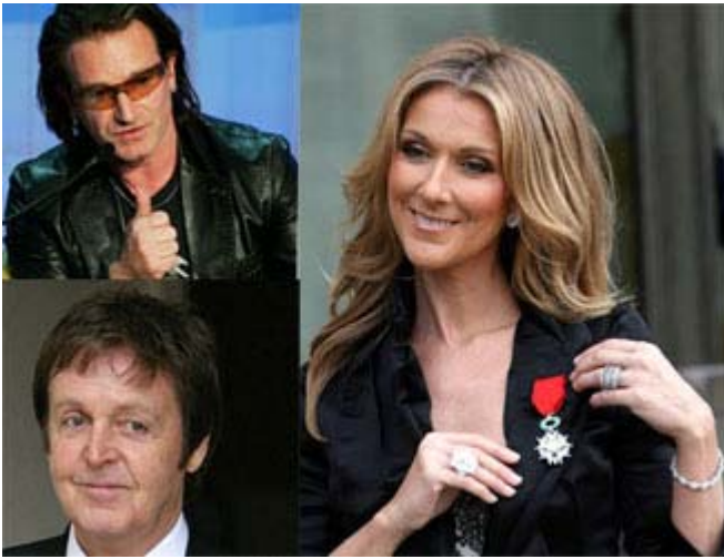
Bono, Paul McCartney et Céline Dion

(Photo de Céline à Paris - Légion d'honneur)