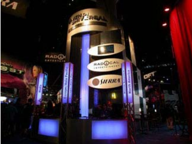
Kiosque d'exposition Videndi

L'industrie des jeux vidéo et du cinéma est en pleine transformation. Au Québec, deux entreprises ont récemment fusionné, Ubisoft qui a acquis Hybride Technologies , mais c'est la transaction entre Vivendi et Activision qui retient l'attention. La nouvelle entreprise portera le nom Activision Blizzard et celle-ci détiendra le premier rang mondial des entreprises en jeux vidéo avec des revenus de 3,8 milliards$!