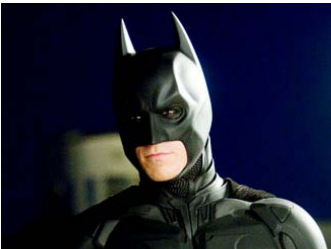
Batman - The Dark Knight

Le film Batman, The Dark Knight , est arrivé en ville. Il s'agit du 6e film depuis l'arrivée du justicier