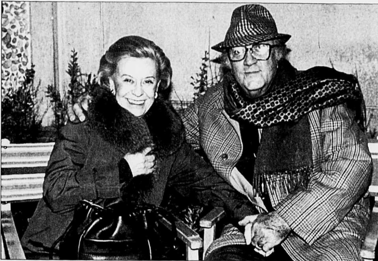
Federico Fellini en compagnie de sa femme Giuletta Masina, comédienne et héroïne d'un de ses premiers films La Strada . La photo a été prise l'an dernier.