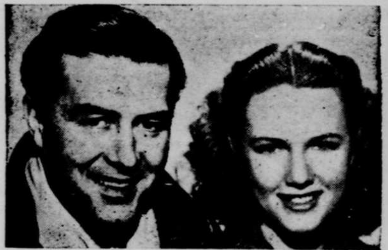
Ray Milland et Barbara Britton, les deux principales étoiles du film dramatique "Till We Meet Again", à l'affiche du Théâtre Capitol, pour 3 jours, à compter de dimanche, le 3 juin.