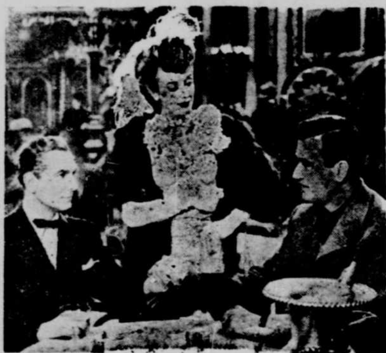
Joseph Schildkraut, Ann Dvorak, et John Wayne dans une scène excitante du film "Flame of Barbary Coast", en primeur sur l'écran du Théâtre Impérial, dimanche à mercredi, les 3-4-5-6 juin.