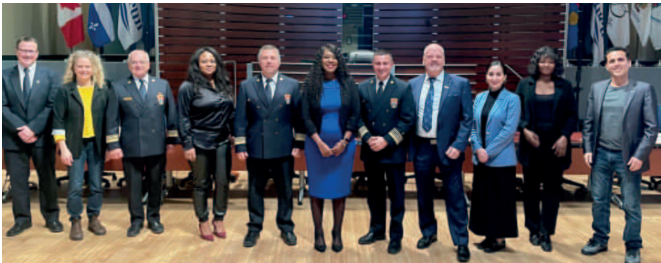
SCHÉMA DE COUVERTURE DE RISQUES INCENDIE 2023-2027

Le projet de Schéma de couverture de risques en incendie 2023-2027 a été présenté à la Commission de la sécurité publique (CSP) du 3 novembre dernier. Par la suite, la CSP a procédé à une consultation publique pour les citoyennes et citoyens de l'agglomération le 7 décembre, en conformité avec l'obligation légale de tenir une assemblée publique de consultation selon l'article 18 de la Loi sur la sécurité incendie .