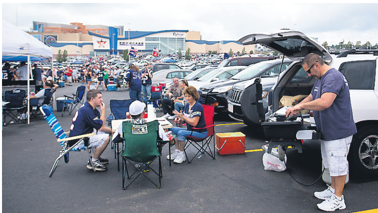
Des partisans discutent stratégie tandis que d'autres jouent... aux poches.