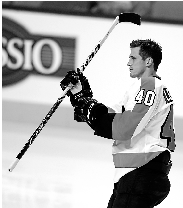
Vincent Lecavalier n'a obtenu que 37 points en 69 matchs l'an dernier.

La saison 2014-elle une sorte de renaissance pour Vincent Lecavalier? Il fallait le voir fêter tel un gamain quand il a marqué son premier but de la saison jeudi soir, dans une défaite contre