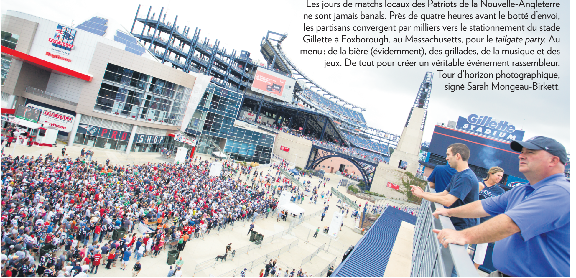
Arrivée des partisans des Patriots, le 21 septembre dernier, avant le match contre les Raiders d'Oakland.

Les jours de matchs locaux des Patriots de la Nouvelle-Angleterre ne sont jamais banals. Près de quatre heures avant le botté d'envoi, les partisans convergent par milliers vers le stationnement du stade Gillette à Foxborough, au Massachusetts, pour le tailgate party . Au menu: de la bière (évidemment), des grillades, de la musique et des jeux. De tout pour créer un véritable événement rassembleur. Tour d'horizon photographique, signé Sarah Mongeau-Birkett.