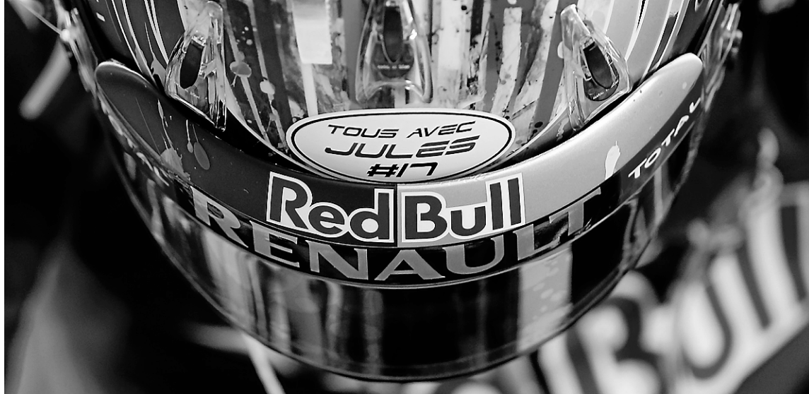
La plupart des pilotes au premier Grand Prix de Russie portaient hier un autocollant «Tous avec Jules #17» (ici Sebastian Vettel), en l'honneur de Jules Bianchi, toujours à l'hôpital dans un état critique après avoir heurté un tracteur lors du Grand Prix du Japon, la semaine dernière.

«Jules se bat comme il s'est toujours battu. Comme en course. Il est fort. Il a 25 ans. C'est un athlète», a confié son