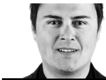
MIGUEL BUJOLD NFL

L'entraîneur des Bears de Chicago sous le feu des critiques