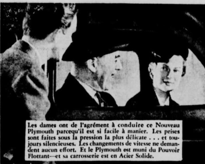
Les dames ont de l'agrément à conduire ce Nouveau Plymouth parcequ'il est si facile à manier. Les prises sont faites sous la pression la plus délicate... et toujours silencieuses. Les changements de vitesse ne demandent aucun effort. Et le Plymouth est muni du Pouvoir Flottant—et sa carrosserie est en Acier Solide.