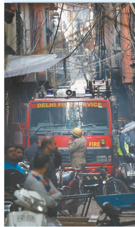
Un camion de pompier dans les rues étroites du quartier Sadar Bazar