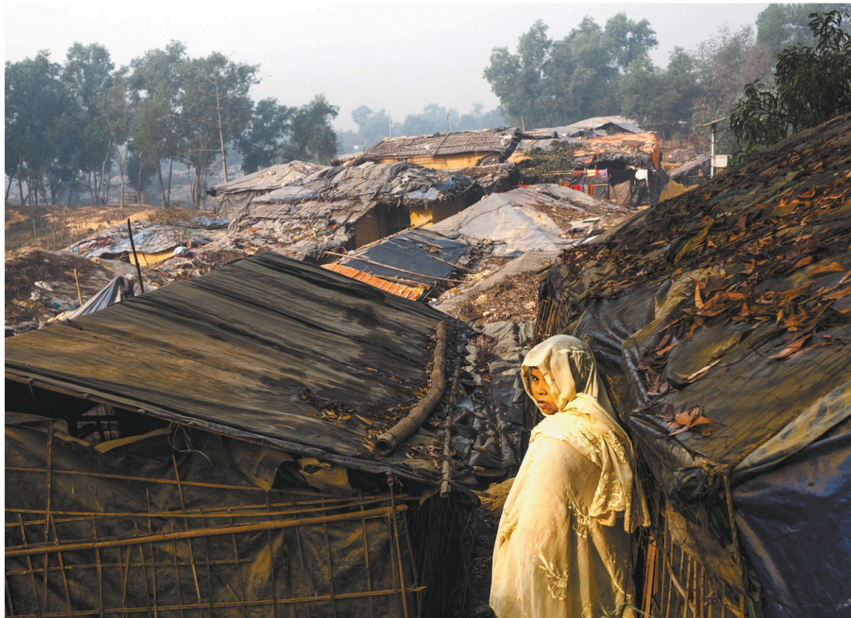
La Gambie estime que le Myanmar, Aung San Suu Kyi en tête, a violé la convention des Nations unies sur le génocide avec sa répression sanglante des Rohingyas, dont des milliers se sont réfugiés au Bangladesh.