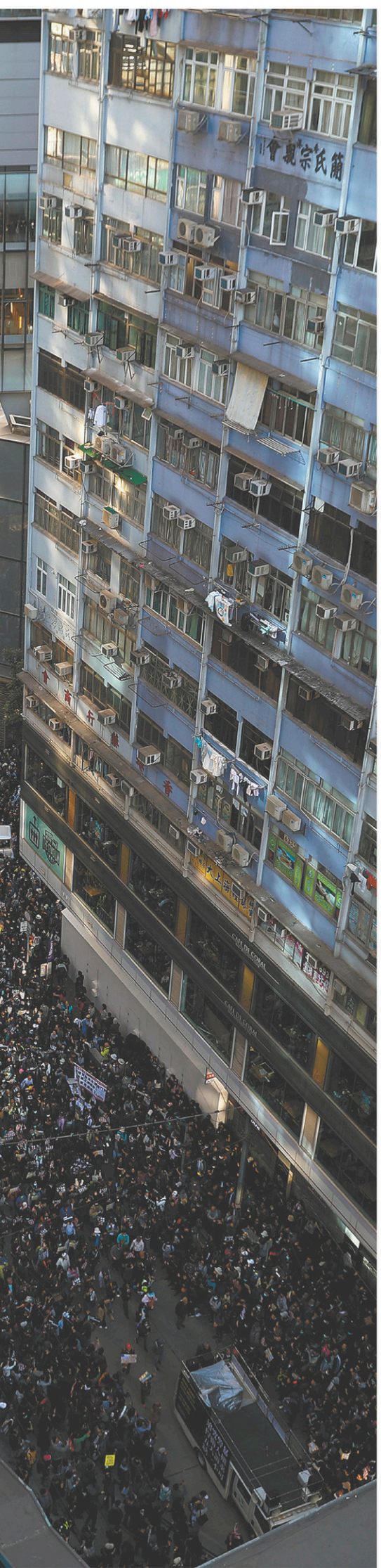
Manifestants à Hong Kong, en juin dernier.