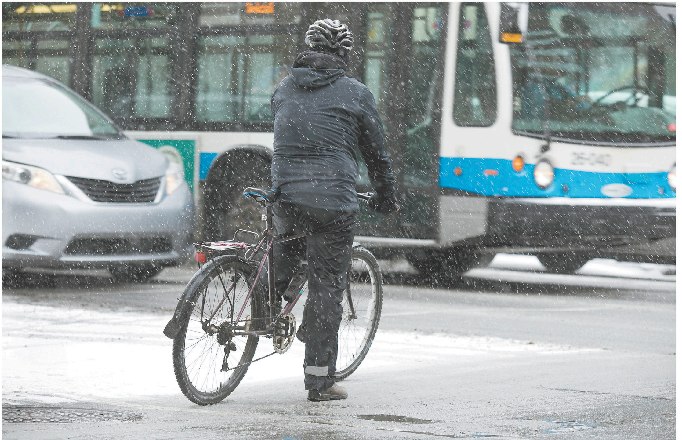
Certains étudiants ont suggéré une reconfiguration de l'espace urbain en redessinant une intersection dangereuse, notamment pour les cyclistes.