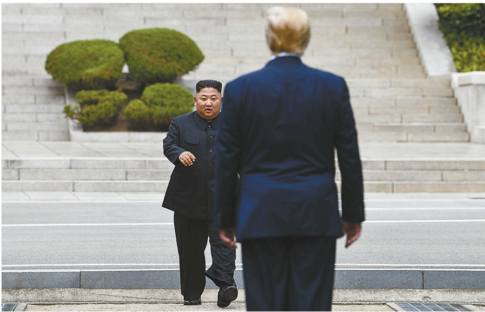
Le président américain croit que le dirigeant nord-coréen aurait « trop à perdre » s'il agissait de façon hostile.