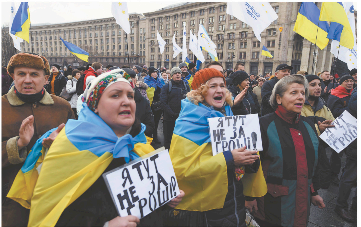
Dimanche, environ 5000 personnes sont descendues dans les rues de Kiev pour exhorter M. Zelensky à ne pas céder à la pression de son homologue russe.