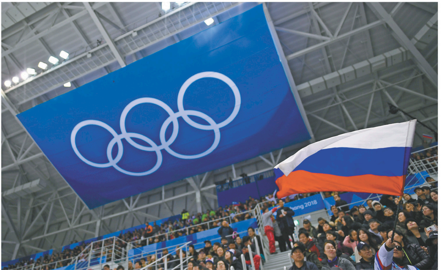
Menacée d'exclusion pour quatre ans des Jeux olympiques et paralympiques, la Russie reste néanmoins un géant du sport mondial.

La profondeur du Canadien a été mise à l'épreuve depuis que Jonathan Drouin et Paul Byron sont tombés au combat