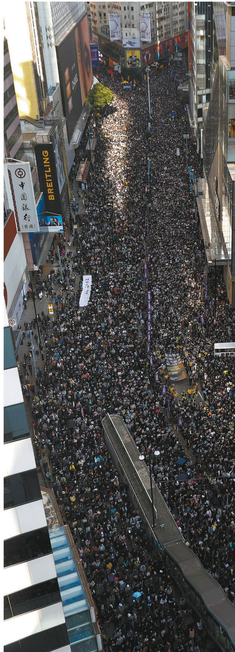
La foule de dimanche était la plus grande depuis le début des protestations.

« Quelle que soit la façon dont nous exprimons nos opinions, par une marche pacifique, par des élections civilisées,