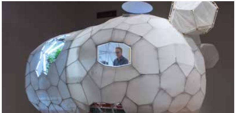
Crédit : Daniel Corbeil, Module de survie , 2017.