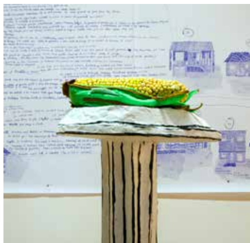
Crédit : Julie Lequin, Cartographie du Manoir (détail), 2018.